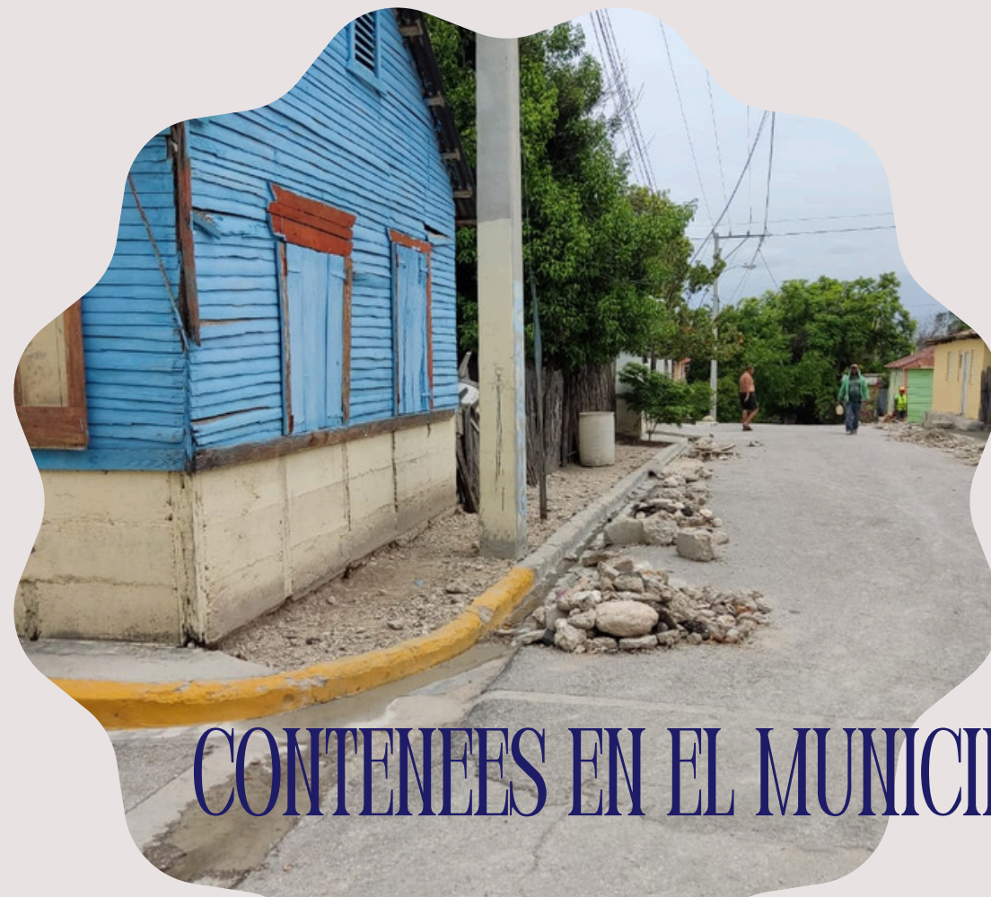
CONTENEES EN EL MUNICIPIO