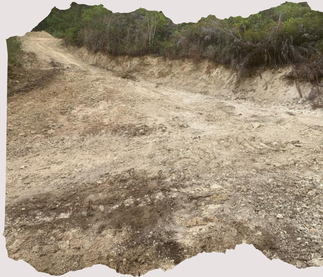
MATA DE NARANJA