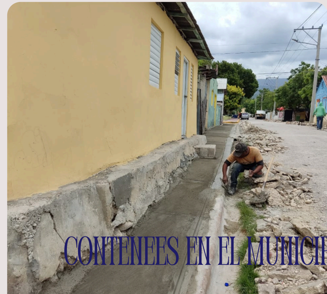
CONTENEES EN EL MUNICIPIO