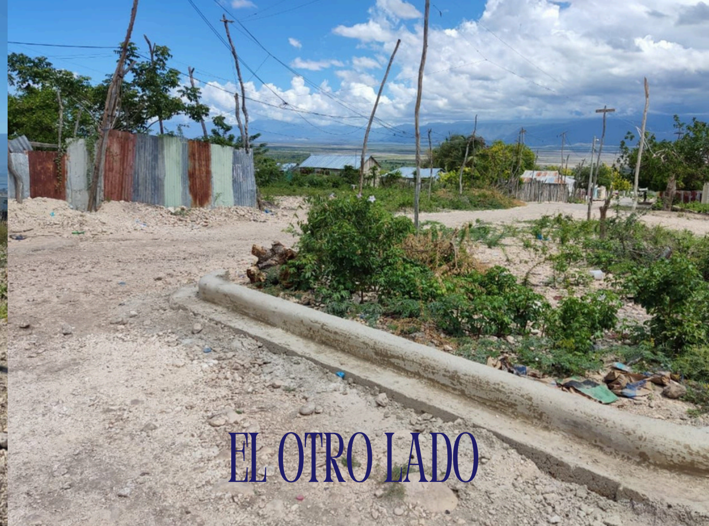
EL OTRO LADO