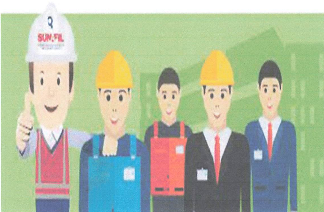
Comité Mixto de Seguridad y Salud Laboral