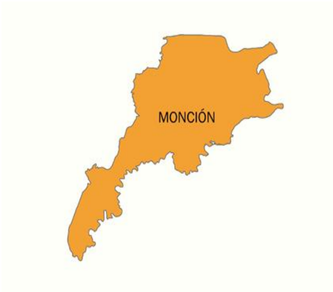
ILUSTRACIÓN MAPA DEL MUNICIPIO DE MONCIÓN