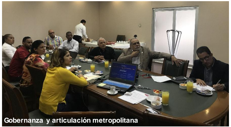
Gobernanza y articulación metropolitana