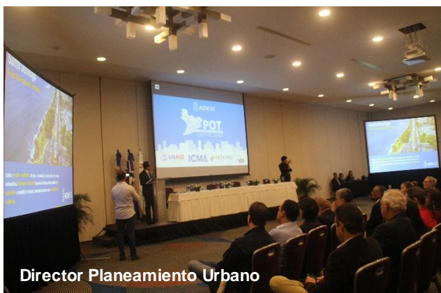
Director Planeamiento Urbano