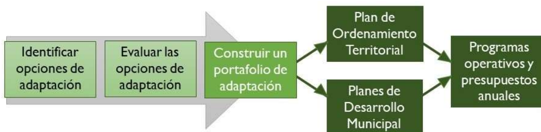
Figura 1. Vías para la implementación del portafolio de adaptación.