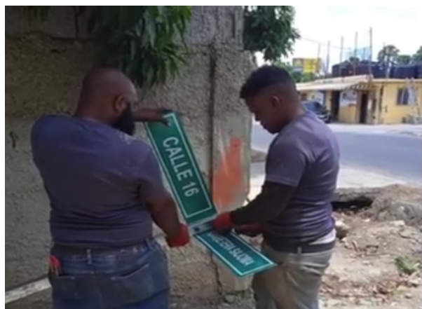
Empleados del ayuntamiento instalan los letreros

Con este trabajo Hato del Yaque se convertirá en uno de los distritos más organizados del país y facilitará los trabajos para llegar a los diferentes sectores.