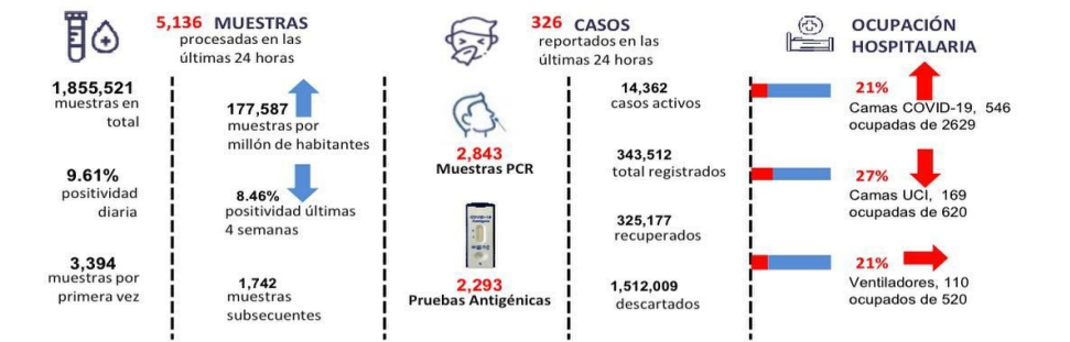
Figura 1. Tendencia de los casos v positividad de COVID-19 en República Dominicana