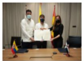
SANTO DOMINGO Y BARRANQUILLA FIRMAN HERM...