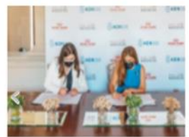
FIRMAN ACUERDO PARA CREAR UN PARQUE PARA...