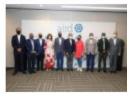
INSTITUCIONES PONDRÁN EN MARCHA PLAN PIL...