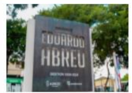
ADN Y BANRESERVAS ENTREGAN REMOZADO EL P...