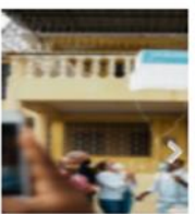
ADN NOMBRA CA SALESIANOS EN S