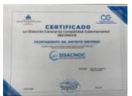
ADN RECIBE CERTIFICACIÓN QUE RECONOCE LA...