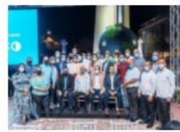
ADN RECONOCE COMO