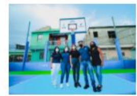
REXONA Y ADN ENTREGAN