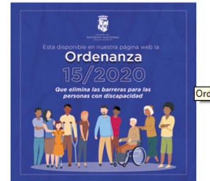
Ordenanza No. 15 2020