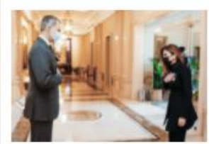
ALCALDESA CAROLINA MEJÍA ASUME VICEPRESI...