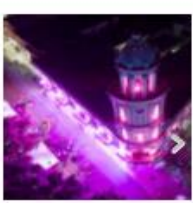
PALACIO CONSIS SE ILUMINA DE R