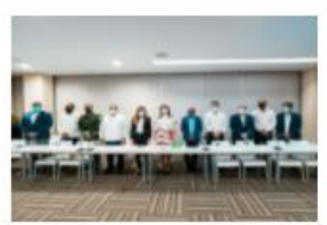
INICIA PILOTO PARA MEDICIÓN TEMPORAL DEL...