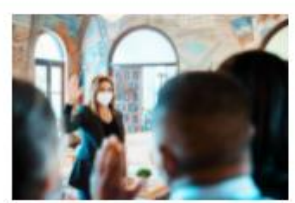
ADN JURAMENTA COMITÉ E INICIA ASAMBLEAS ...