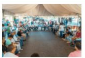
ADN ANUNCIA CONSTRUCCIÓN DE PASEO DEL IN...