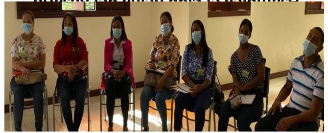
Autoridades del Distrito Cana Chepton visitan hato del

Con el propósito de intercambiar experiencia y procurando el bienestar de todas las juntas distritales de la región recibimos en el edificio administrativo la comisión de la Junta de Distrito Municipal de Cana Chapetón, a quienes orientamos sobre correcta implementación del SISMAP Municipal.