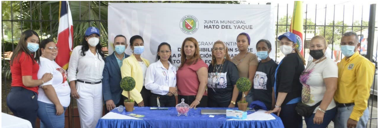
Participantes y organizadores de la feria

Hato del Yaque, Santiago, R. D.- La Junta de Distrito de Hato del Yaque, a través de la oficina de familia y género realizó este martes la 1ra Feria de Sensibilización, Prevención y Erradicación de todas las Formas de Violencia. La actividad se enmarca en el cierre de las actividades por el mes de la lucha contra la violencia y como parte del plan continuo de lucha contra la violencia.