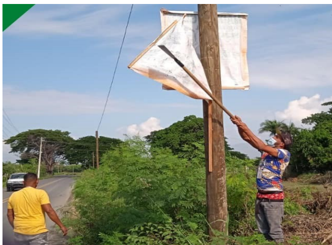
Eliminando la contaminación visual en la Junta Distrital

Comprometidos con el cuidado de nuestro distrito y la eliminación de la contaminación visual en nuestro entorno. En la mañana de hoy el departamento medio ambiente estuvo retirando varios tipos de publicidad en las distintas vías, ayudando y evita recargar los espacios públicos.