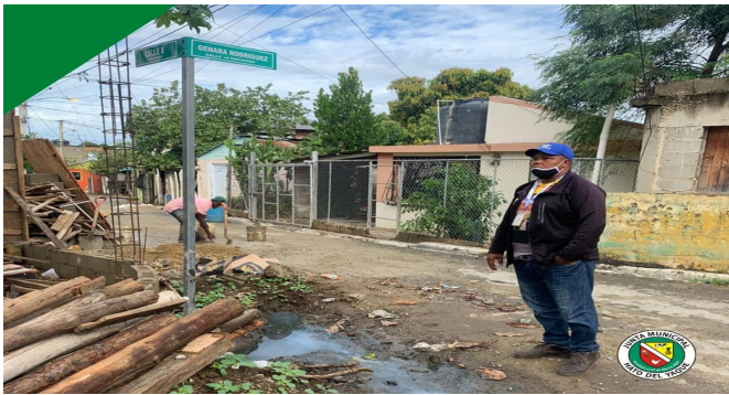
Señalización de calles

El departamento de medio ambiente levantó y emitió un informe sobre la obstrucción de la vía pública en la intercepción de las Calle 8 esquina Genara Rodríguez, sector La Rinconada.