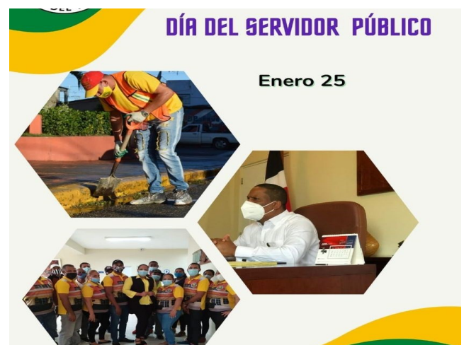
Día del servidor pública

El día 25 de enero de cada año se celebra el “Día Nacional del Servidor Público”, según la ley 302 de 1981, con el objetivo de reconocer la labor de los funcionarios y empleados que cumplen con eficiencia a la administración pública. Hoy reconocemos el merito de nuestros servidores y agradecemos el empeño y disciplina con el que ejercen su función.