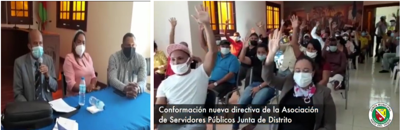
Los empleados durante la reunión electiva en la Junta Distrital