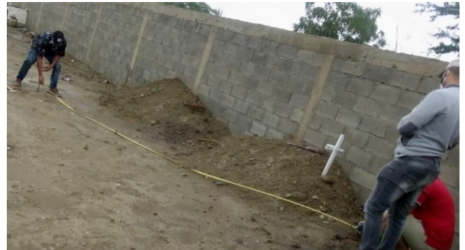
Servicios en el Cementerio

La Junta Distrital ofreciendo los servicios que los contribuyentes necesitan, con la calidad y transparencia que nos caracteriza. Por eso velamos por que las medidas dispuestas para los espacios de enterramiento sean correctas en el Cementerio Remanso de Paz.