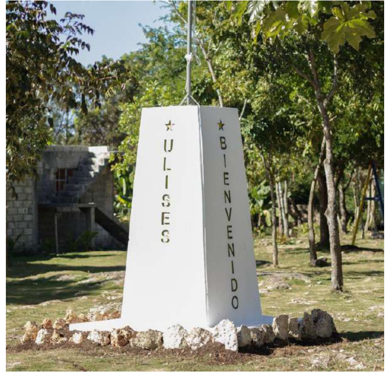
Monumento que honra la lucha que libraron los jóvenes por la libertad del país.

El Ayuntamiento de Santo Domingo Este, junto a la Fundación Amaury Germán Aristy, conmemorarán el Día de la Resistencia Heroica en un acto que se realizará este miércoles en el Monumento a Los Palmeros.