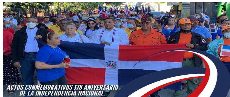
Los hijos de la patria de Duarte, Sánchez y Mella levantan orgullosos su bandera tricolor.

Hato del Yaque, Santiago, R.D.- La Junta de Distrito Hato del Yaque, centros educativos, comunidad cristiana, líderes comunitarios e instituciones locales celebran el 178 aniversario de la independencia nacional, el 206 aniversario del natalicio de Matías Ramón Mella Castillo y rindieron tributos a nuestros héroes libertadores.