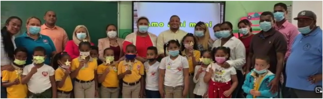
Comisión de la Junta Distrital visitan el Centro Educativo Fe y Alegría.

Cada 18 de febrero se celebra el día de los estudiantes, en este año 2022 volvimos a las aulas a celebrar con nuestros niños y niñas del centro educativo Fe y Alegría el día de los estudiantes.