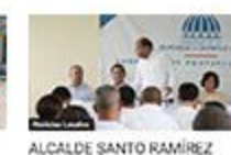
ALCALDE SANTO RAMÍREZ ASISTE ENCUENTRO EL GOBIERNO EN LAS PROVINCIAS CORRESPONDIENTE A PERAVIA.