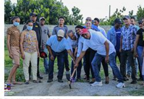
PRIMER PICAZO VILLA REAL CISTERNA DEL PARQUE