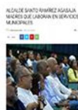
ALCALDE SANTO RAMÍREZ ASISTE ENCUENTRO EL GOBIERNO EN LAS PROVINCIAS CORRESPONDIENTE A PERAVIA.