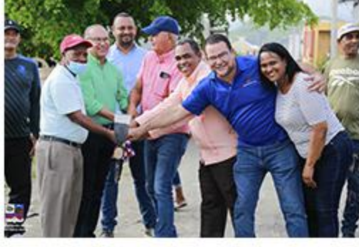
PRIMER PICAZO BARRACONES CENTRAL ACERAS Y CONTENES