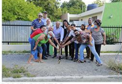
PRIMER PICAZO LOS MELONCITOS ACERAS Y CONTENES