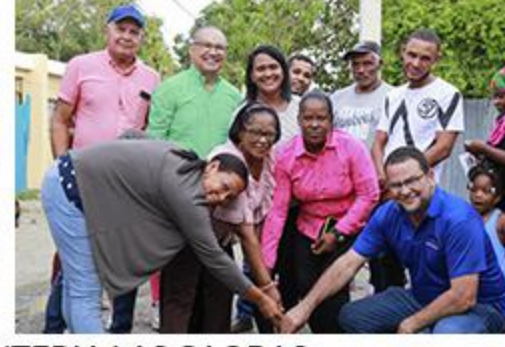
PRIMER PICAZO MONTERIA LAS CAOBAS ENCACHE EN MURO