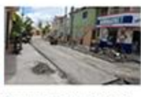
Ayuntamiento de Bani realiza repapeo en calle Manuel de Regla Mota