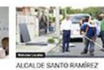
ALCALDE SANTO RAMÍREZ ASISTE ENCUENTRO EL GOBIERNO EN LAS PROVINCIAS CORRESPONDIENTE A PERAVIA.