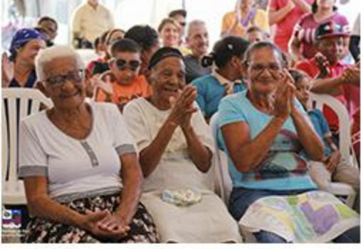
ACTO REPARACIÓN DE VIVIENDAS SAONA ABAJO