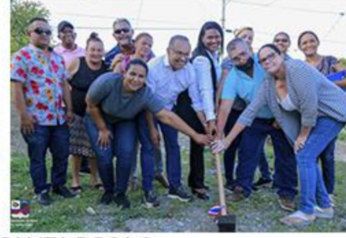
PRIMER PICAZO SANTA ROSA 2 ACERAS Y CONTENES