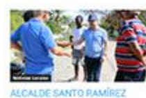
ALCALDE SANTO RAMÍREZ ASISTE ENCUENTRO EL GOBIERNO EN LAS PROVINCIAS CORRESPONDIENTE A PERAVIA.