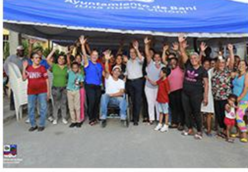
PRIMER PICAZO LAS AREPAS HORMIGONADO CALLEJÓN