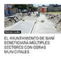
EL AYUNTAMIENTO DE BANI BENEFICIARÁ MÚLTIPLES SECTORES CON OBRAS MUNICIPALES