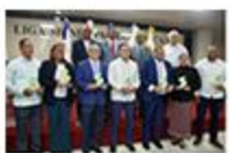
Alcaldía de Bani es reconocida por el SISMAP