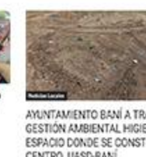
AYUNTAMIENTO BANI A TRAVÉS GESTIÓN AMBIENTAL HIGIENIZA ESPACIO DONDE SE CONSTRUIRÁ CENTRO UASD-BANI.