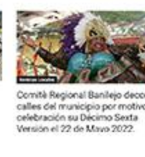
Comité Regional Banilejo decora calles del municipio por motivo celebración su Décimo Sexta Versión el 22 de Mayo 2022.