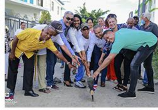
PRIMER PICAZO RES. LOS AGRONOMOS ACERAS Y CONTENES