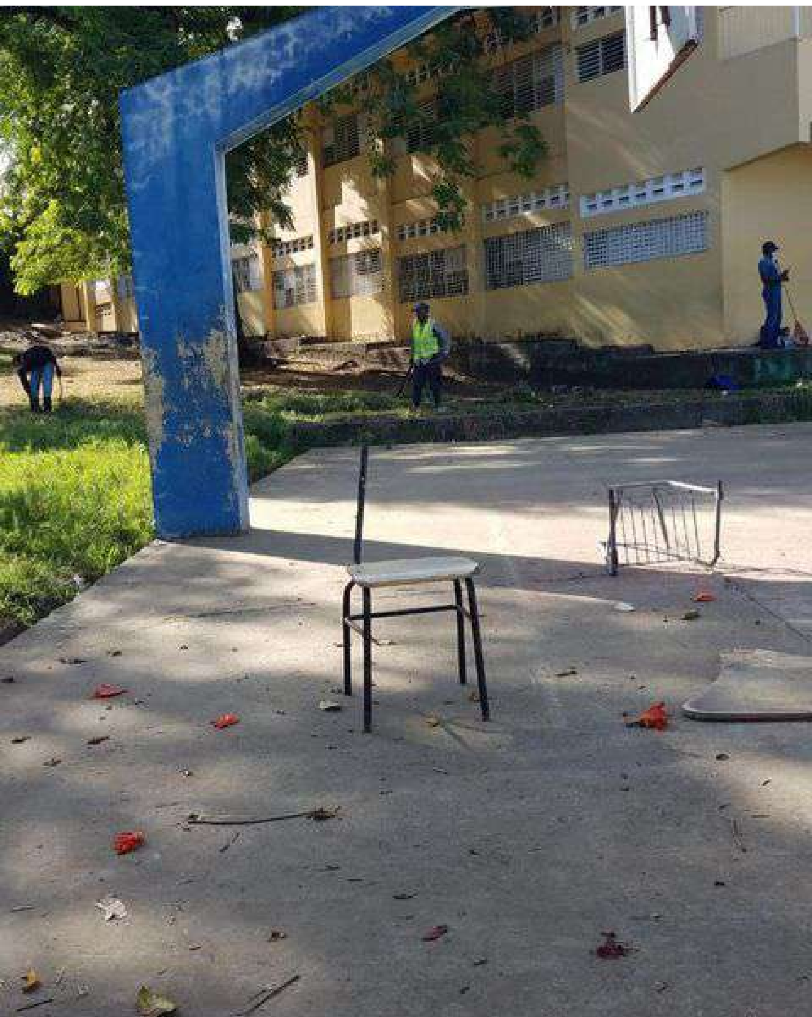
Equipo de chapeo y limpieza en la Escuela Alba luz Casilla Díaz.