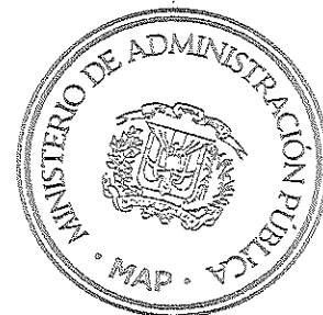
Darío Castillo Lugo Ministro de Administración Pública