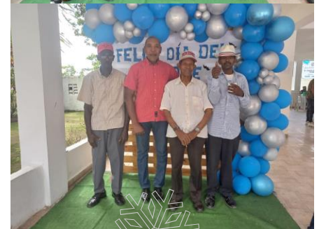
Día de los Padres JMSL