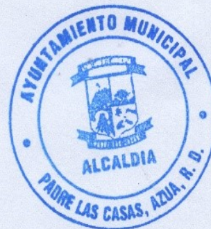
Enc. Planeamiento Urbano