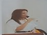
ALCALDESA IBANOVA RAMOS EN SU DISCURSO DE APERTURA EN SU NUEVA GESTO