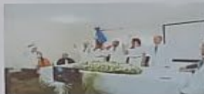
MOMENTO DE LA JURAMENTACION