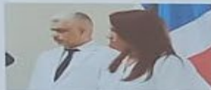
ALCALDESA Y VICE-ALCALDE ACTUALES