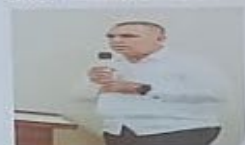
REPRESENTANTE DE LA JUNTA ELECTORAL