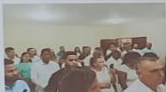
LAS COMUNIDADES DICENDO PRESENTE