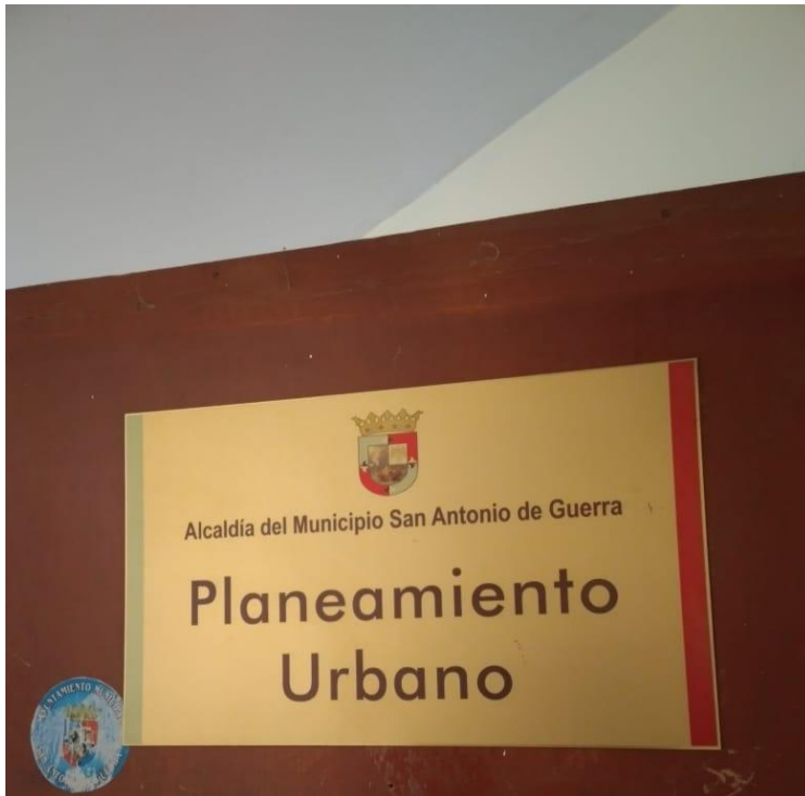
Placa Identificativa del departamento