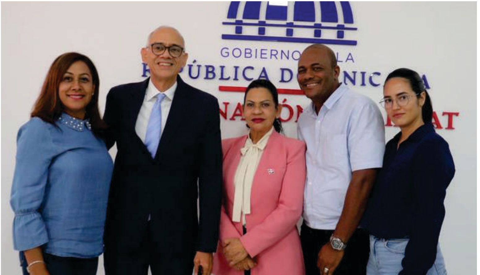
Taller sobre " La Dimensión de La Ética en La Función Pública " Gobernación Provincial de Espaillat.