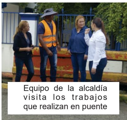
Equipo de la alcaldía visita los trabajos que realizan en puente

El alcalde expresó su gratitud hacia todos los involucrados y destacó que el programa "Basura Cero" marca el inicio de una serie de iniciativas destinadas a transformar positivamente San Víctor.