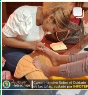
Curso Intensivo Sobre el Cuidado de las Uñas, avalado por INFOTEP.