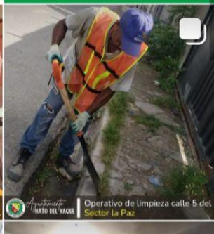
Operativo de limpieza calle 5 del Sector La Paz.