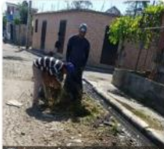
Operativo de limpieza en el cruce de San Antonio con Barrota Paz.