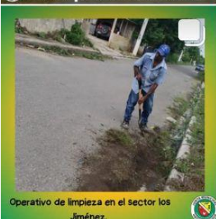
Operativo de limpieza en el sector los Jiménez.