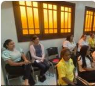
Taller "Inducción a la Administración Pública Nivel 2." INAP.