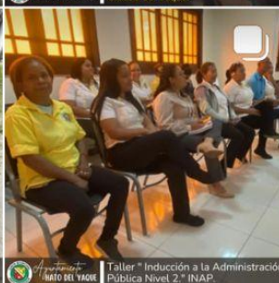
Taller "Inducción a la Administración Pública Nivel 2." INAP.