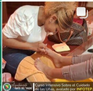
Curso Intensivo Sobre el Cuidado de las Uñas, avalado por INFOTEP.