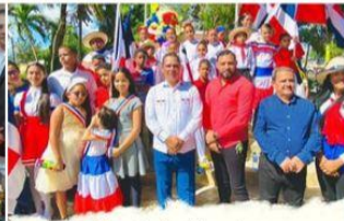
Desfile estudiantil y actos conmemorativos en ocasión del 179 Aniversario de la Independencia.