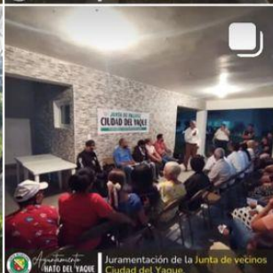
Juramentación de la Junta de vecinos Ciudad del Yaque.