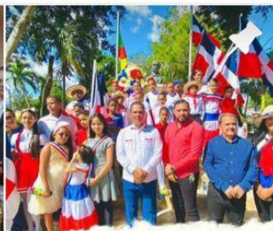
Desfile estudiantil y actos conmemorativos en ocasión del 179 Aniversario de la Independencia.