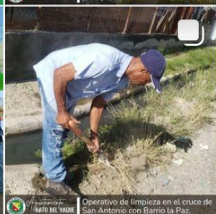
Operativo de limpieza en el cruce de San Antonio con Barrio La Paz.