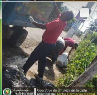
Operativo de limpieza en la calle principal del sector Hermanas Mirabal.