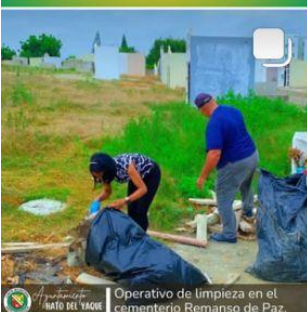
Operativo de limpieza en el cementerio Remanso de Paz.