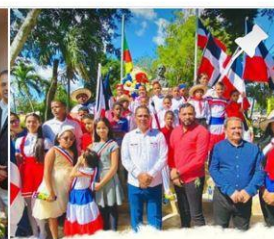
Desfile estudiantil y actos conmemorativos en ocasión del 179 Aniversario de la Independencia.