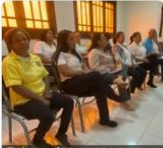
Taller "Inducción a la Administración Pública Nivel 2." INAP.