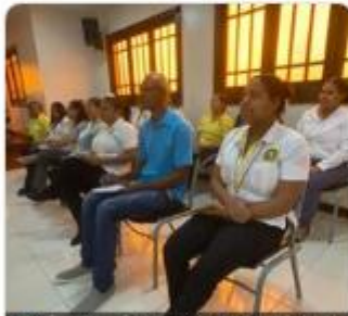
Taller "Inducción a la Administración Pública Nivel 2." INAP.