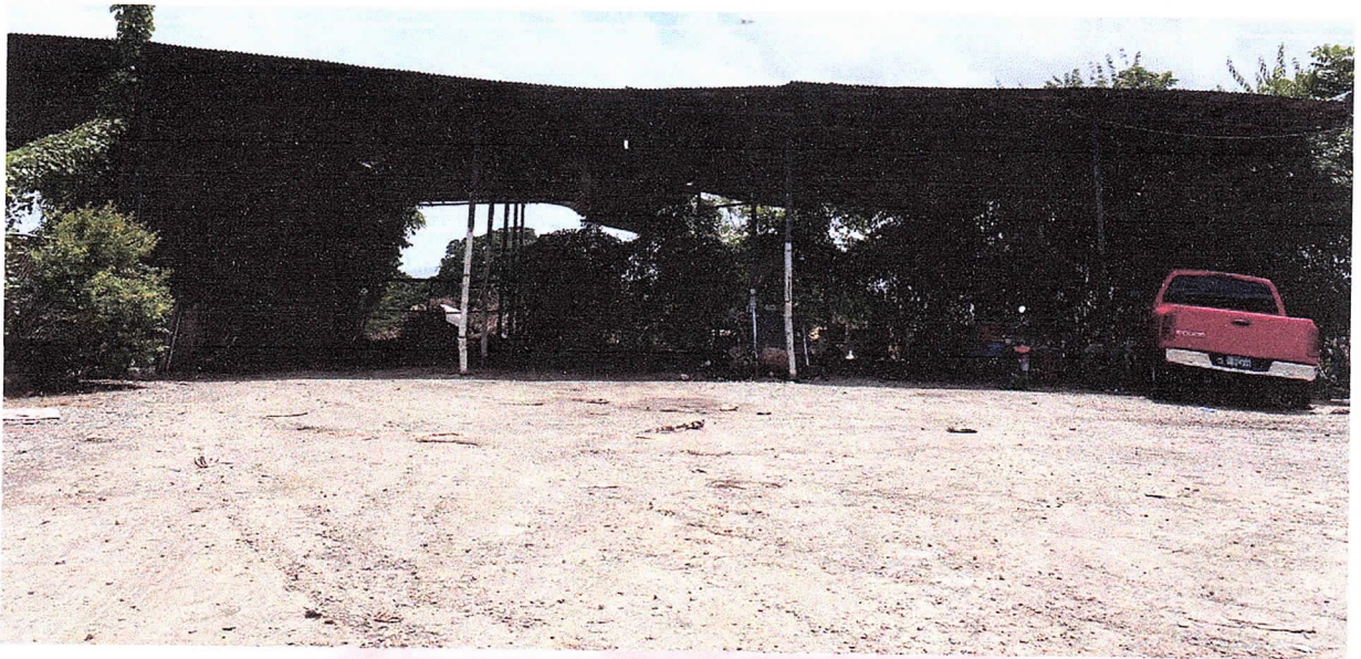
Herramientas utilizadas para las reparaciones de los compactadores.