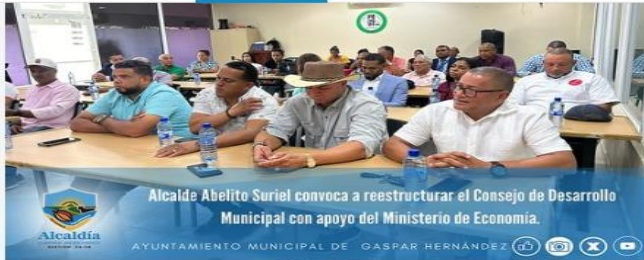
Alcalde Abelito Suriel convoca a reestructurar el Consejo de Desarrollo Municipal con apoyo del Ministerio de Economía.

Información Galería Álbumes Favoritos Expos Grupos Estadísticas Carrete fotográfico