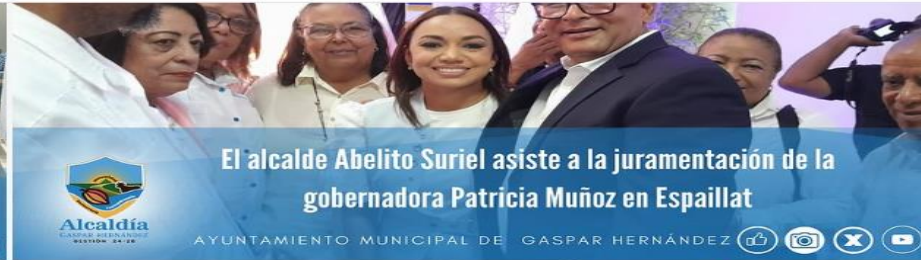
El alcalde Abelito Suriel asiste a la juramentación de la gobernadora Patricia Muñoz en Espailat