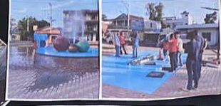
Reparación de las fuentes de nuestro parque central. Embelleciendo nuestro pueblo día a día.