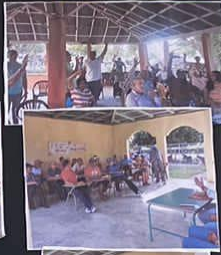
Asambleas comunitarias para el presupuesto participativo en las diferentes comunidades. LO NUESTRO ES TRABAJAR CON TRANSPARENCIA.