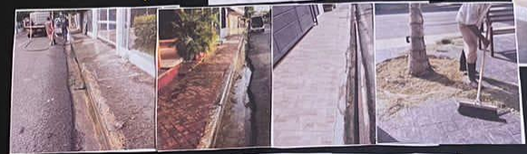
Limpieza de las diferentes calles de nuestro pueblo, la alcaldía de Luperón junto con el cuerpo de bombero.