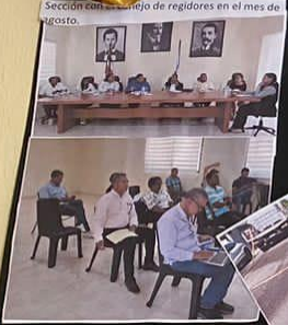
Sección de trabajo de regidores en el mes de agosto.