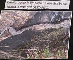
Comienzo de la limpieza de nuestra bahía. TRABAJANDO SIN DESCANSO.