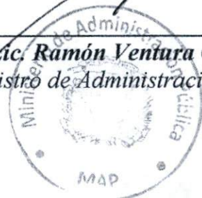
Lic. Ramón Ventura Camejo Ministro de Administración Pública