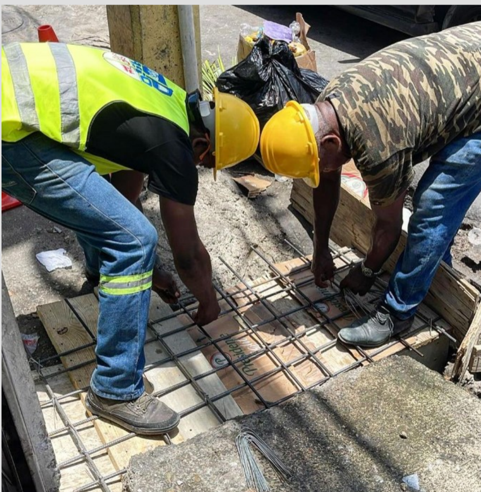
Reparación tapa de drenaje que impedía el tránsito peatonal, en el KM 12.