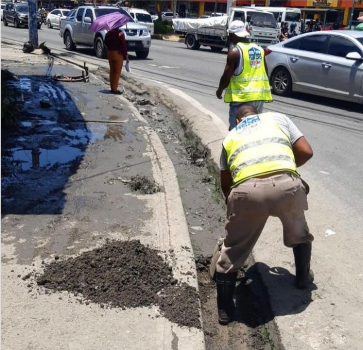
Intercesión Prolongación 27 de febrero con Av. Los Beisbolista.

Siguiendo la misma línea señalamos los diferentes puntos en que se estuvieron llevando a cabo cuneteo, limpieza, mantenimiento, reparación y colocación de parrillas de imbornales en diferentes puntos del municipio.