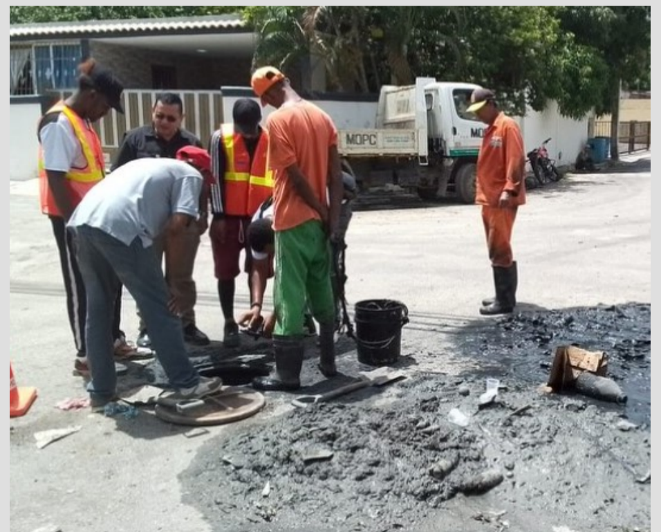
Villa Aura, C/20, Esq.13.