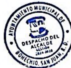
Domingo Suzaña Abreu Alcalde Municipal de Bohechio