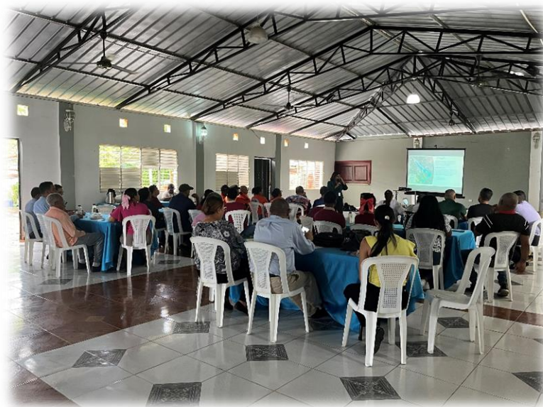
Panorámica general del público asistente al taller.