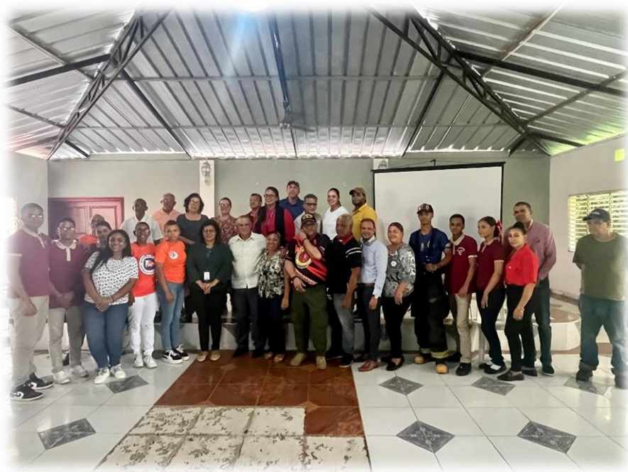
Foro grupal después de la exitosa actividad.