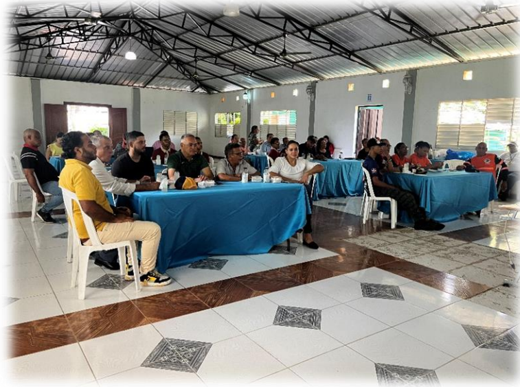
Panorámica general del público asistente al taller.