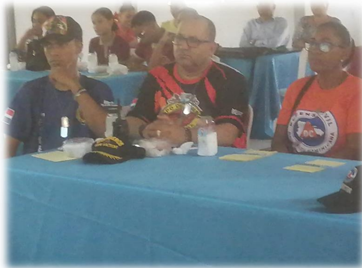
Miembros del Cuerpo de Bomberos de San Víctor, actores indispensables en esta capacitación, acompañados de miembros de la Defensa Civil.