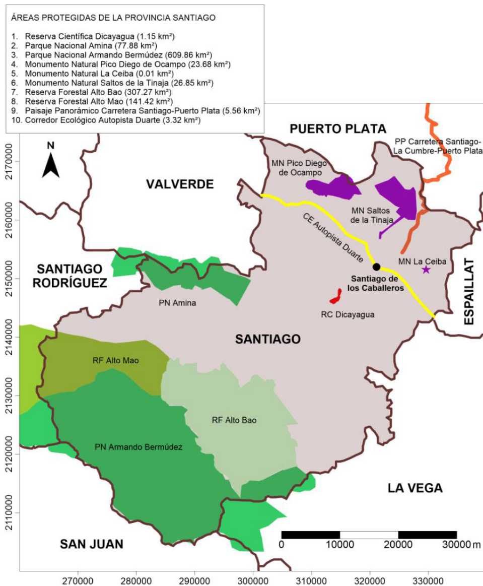
Áreas Protegidas de Santiago.