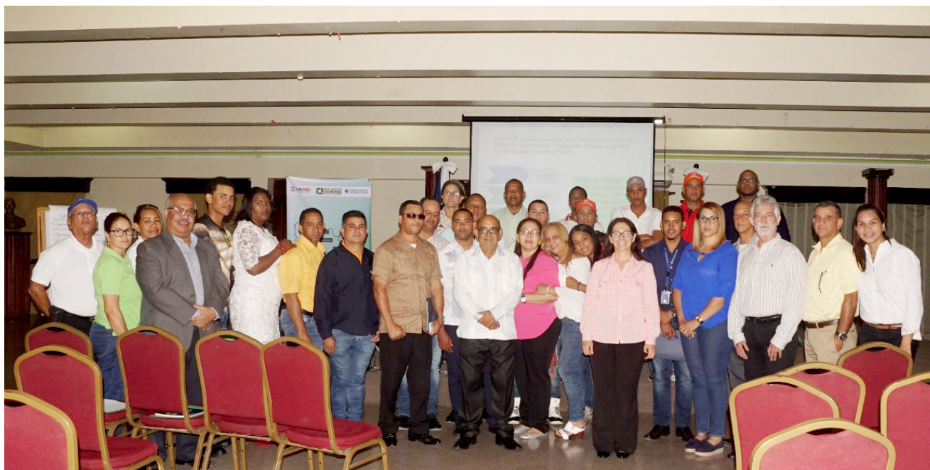
Participantes en el taller de fortalecimiento de la UGAM del Ayuntamiento de Santiago.