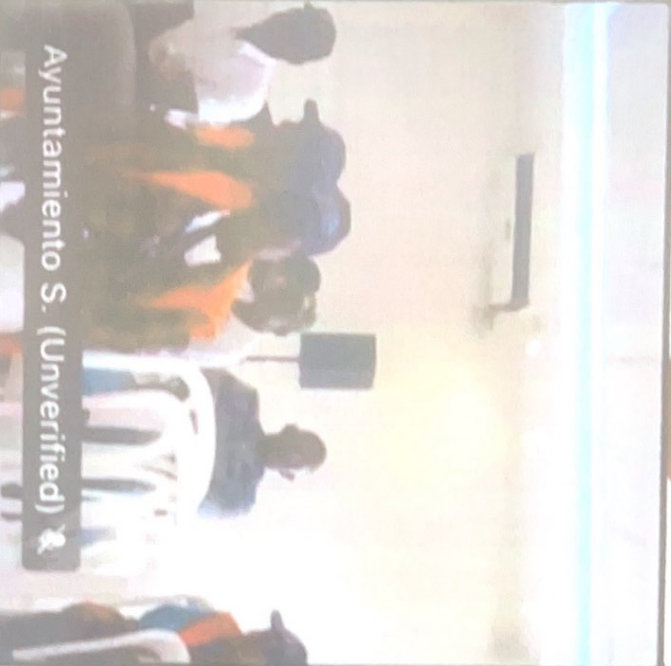
Ayuntamiento S. (Unverified) &