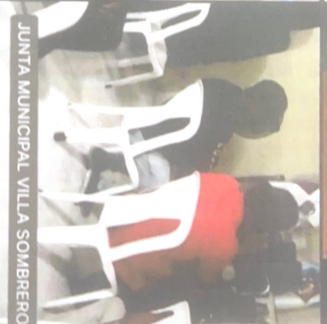
JUNTA MUNICIPAL VILLA SOMBRERO