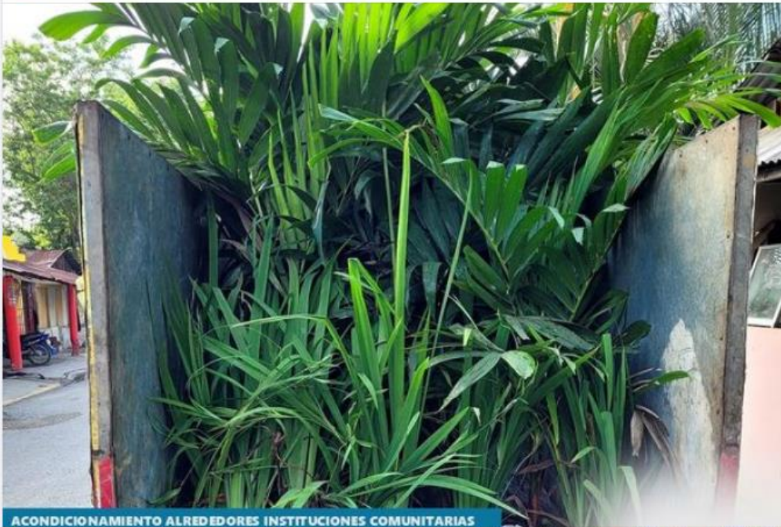
ACONDICIONAMIENTO ALREDORES INSTITUCIONES COMUNITARIAS