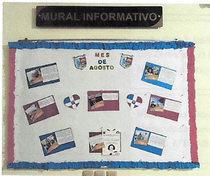
MURAL MES DE AGOSTO 2024