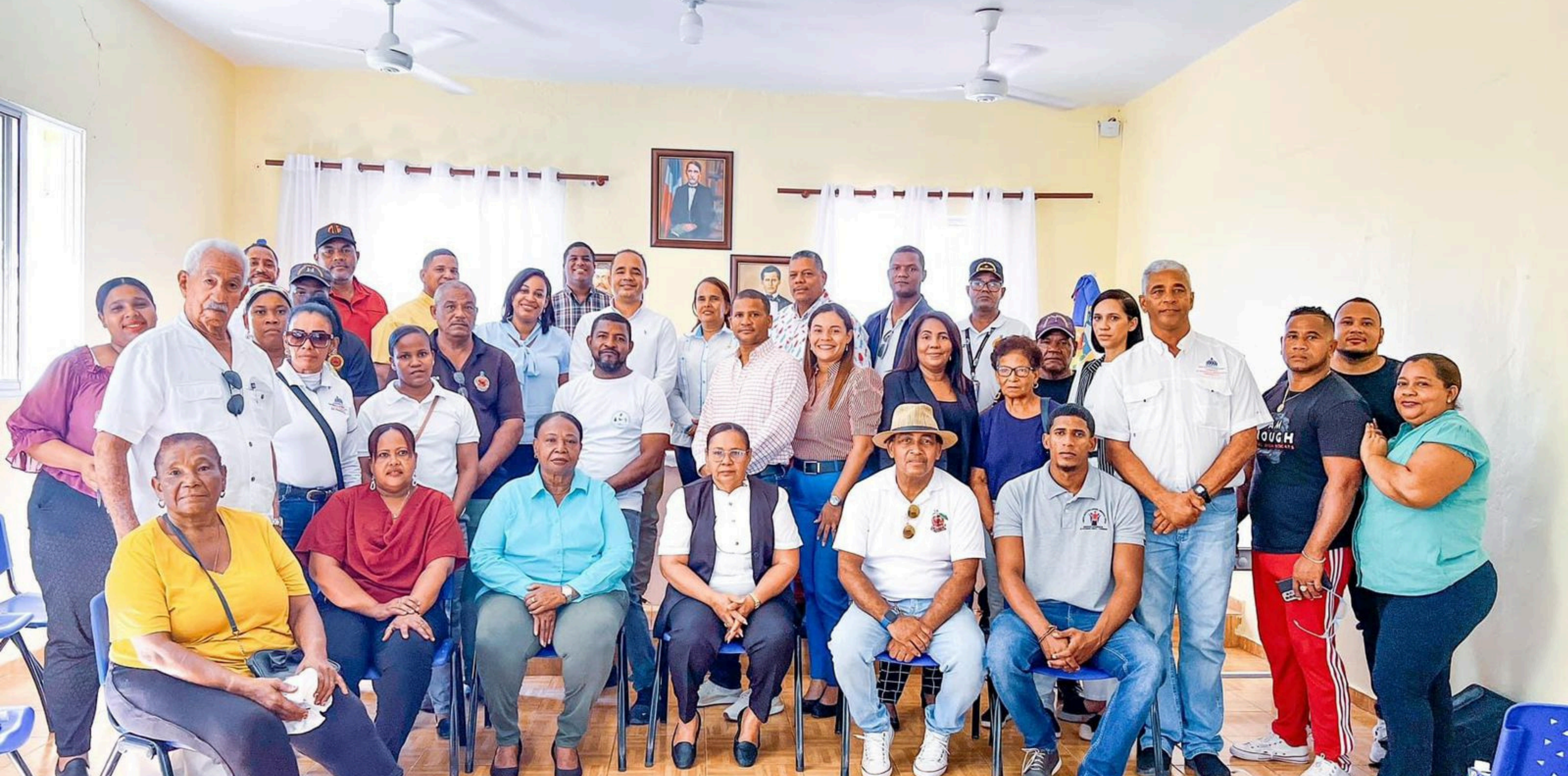
MINUTA CONFORMACIÓN DE MESAS TEMÁTICAS, CONSULTAS A TEMAS ESPECÍFICOS QUE AFECTAN AL MUNICIPIO, CON EL FIN DE IDENTIFICAR PLANES PROGRAMAS, PROYECTOS Y ACCIONES A INCLUIR EN EL PMD. AVENIDA DUARTE #46, PEDIRA-LHES, R. D. RNC: 417000316 / TEL: 849-356-4618