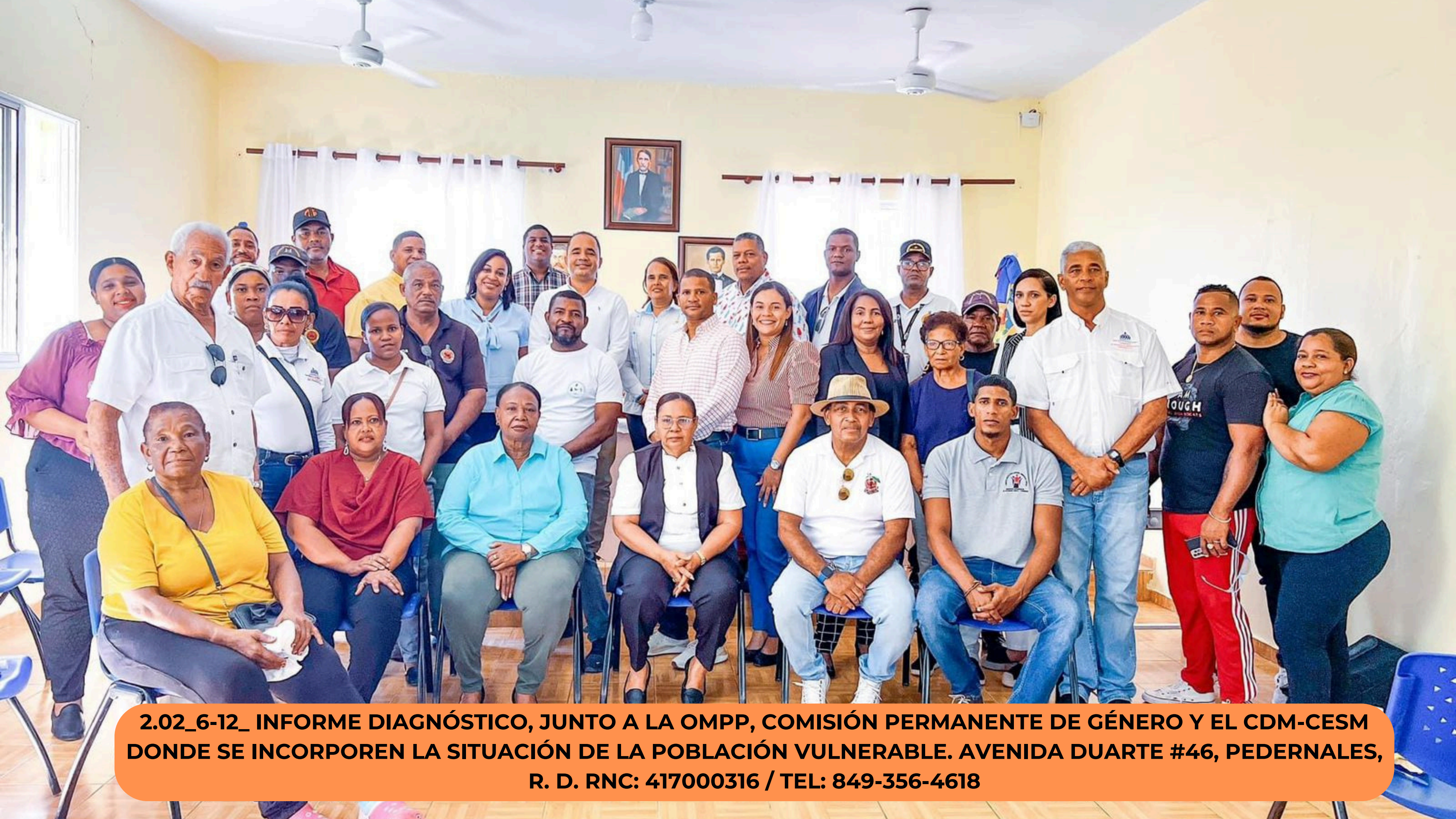
2.02_6-12_ INFORME DIAGNÓSTICO, JUNTO A LA OMPP, COMISIÓN PERMANENTE DE GÉNERO Y EL CDM-CESM DONDE SE INCORPOREN LA SITUACIÓN DE LA POBLACIÓN VULNERABLE. AVENIDA DUARTE #46, PEDERNALES, R. D. RNC: 417000316 / TEL: 849-356-4618