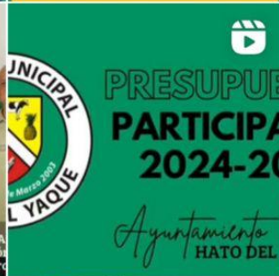
Presupuesto Participativo 2024-2025