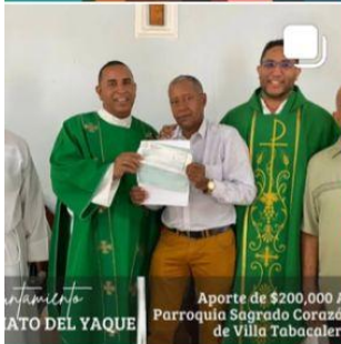
Aporte de $200,000 A Parroquia Sagrado Corazón de Villa Tabacalera.