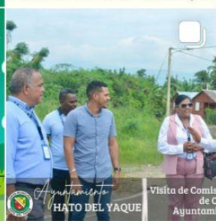
Visita de Comisión del Departamento de Catastro del Ayuntamiento de Santiago.