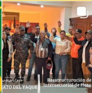
Reestructuración de la Comisión Intersectorial de Hato del Yaque.