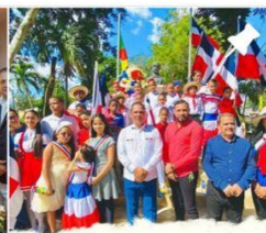
Desfile estudiantil y actos conmemorativos en ocasión del 179 Aniversario de la Independencia.