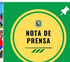
NOTA DE PRENSA