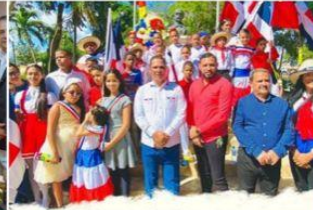
Desfile estudiantil y actos conmemorativos en ocasión del 179 Aniversario de la Independencia.