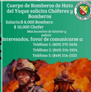
Cuerpo de Bomberos de Hato del Yaque solicita Chóferes y Bomberos. Salario: $ 8,000 Bombero $ 10,000 Chofer. Más Incentivo de Interior y policía. Interesados, favor de comunicarse a: Teléfono 1: (809) 275-5656 Teléfono 2: (849) 214-1924 Teléfono 3: (849) 214-1323