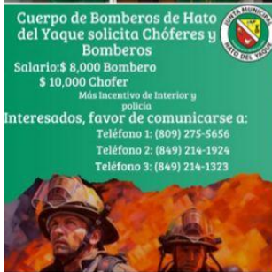
Cuerpo de Bomberos de Hato del Yaque solicita Chóferes y Bomberos. Salario: $ 8,000 Bombero $ 10,000 Chofer. Más Incentivo de Interior y policía. Interesados, favor de comunicarse a: Teléfono 1: (809) 275-5656 Teléfono 2: (849) 214-1924 Teléfono 3: (849) 214-1323