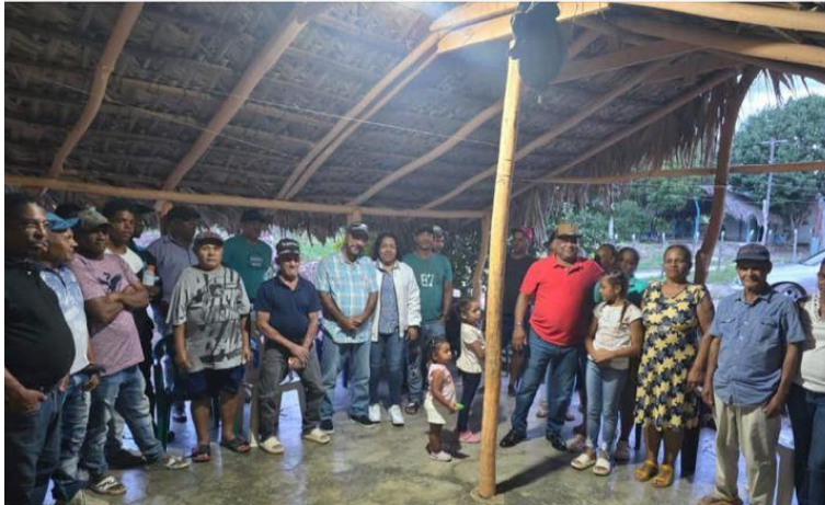
Encuentro Comunitario Platanal Abajo