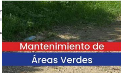
Mantenimiento de Áreas Verdes

< Ayuntamiento del Distrito de la C... 🔍