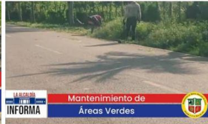
Mantenimiento de Áreas Verdes