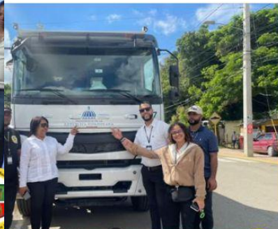
Recibiendo Volteo Para Traslado de Desechos