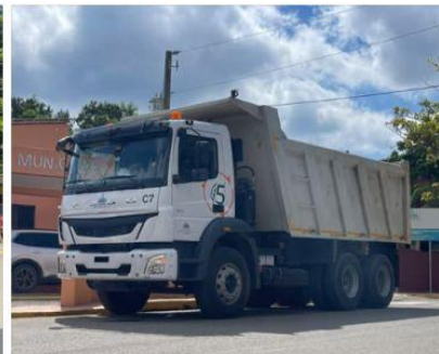
Recibiendo Volteo Para Traslado de Desechos