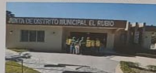
«NO TIENES QUE SER GRANDE PARA EMPEZAR, PERO TIENES QUE EMPEZAR PARA PODER SER GRANDE»

EL SECRETO DEL ÉXITO VERDADERO ES EL CONOCIMIENTO UNIDO A LA ACCIÓN.