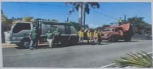
EL TRABAJO EN EQUIPO ES EL SECRETO PARA UN BUEN RESULTADO.