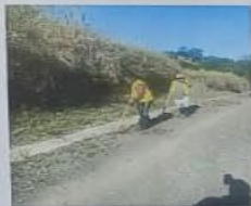
EL ÉXITO SE CONSIGUE CON CONFIANZA, ORGANIZACIÓN Y VALIENTE