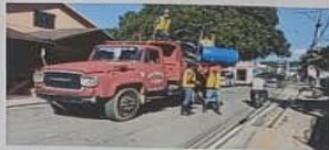
EL TRABAJO EN EQUIPO GENERA CONFIANZA Y LA CONFIANZA GENERA CRECIMIENTO.

ES INCREÍBLE LO QUE SE PUEDE LOGRAR SI NO TE IMPORTA QUIÉN SE LLEVA EL CRÉDITO.