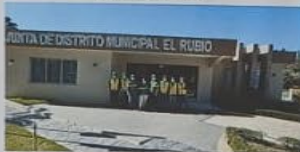
NO SOLO ES CUMPLIR TU PARTE, SINO COLABORAR EN EQUIPO PARA LLEGAR A LA META.

EL SECRETO DEL ÉXITO VERDADERO ES EL CONOCIMIENTO UNIDO A LA ACCIÓN.