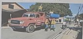
EL TRABAJO EN EQUIPO GENERA CONFIANZA Y LA CONFIANZA GENERA CRECIMIENTO.

ES INCREÍBLE LO QUE SE PUEDE LOGRAR SI NO TE IMPORTA QUIEN SE LLEVA EL CRÉDITO.