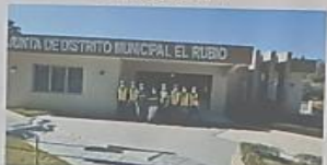
NO SOLO ES CUMPLIR TU PARTE, SINO COLABORAR EN EQUIPO PARA LLEGAR A LA META.

EL SECRETO DEL ÉXITO VERDADERO ES EL CONOCIMIENTO UNIDO A LA ACCIÓN.