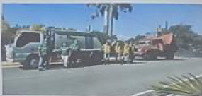
EL TRABAJO EN EQUIPO ES EL SECRETO PARA UN BUEN RESULTADO.