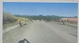
«LA FUERZA NO PROCEDE DE LA CAPACIDAD FÍSICA, SINO DE UNA VOLUNTAD INDOMABLE»

«LA VERDADERA MOTIVACIÓN PROCEDE DE TRABAJAR EN COSAS QUE NOS IMPORTAN»