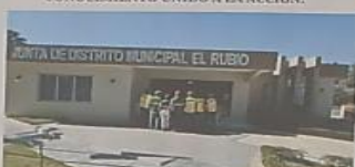
«NO TIENES QUE SER GRANDE PARA EMPEZAR, PERO TIENES QUE EMPEZAR PARA PODER SER GRANDE»

EL SECRETO DEL ÉXITO VERDADERO ES EL CONOCIMIENTO UNIDO A LA ACCIÓN.