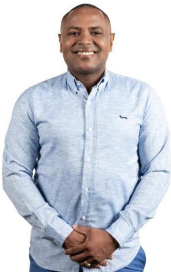
ALCALDE DIVISON SANCHEZ

En un emocionante partido, el equipo de Maimón resultó victorioso frente a Los Paleros de Los Caños, asegurando su pase a la final del torneo, donde se enfrentarán a Los Rapiditos de Los Boboses. Felicitamos a los ganadores