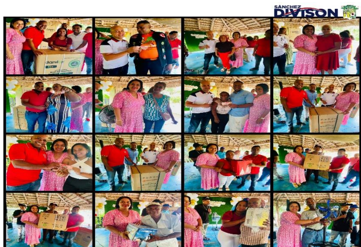
Diciembre 19, 2024

Maimón, Puerto Plata. La Junta Distrital de Maimón celebró su fiesta navideña de manera espectacular, «tirando la casa por las ventanas» con rifas emocionantes para todos sus empleados. Durante el evento, se sortearon diversos premios, desde electrodomésticos hasta órdenes de compra, creando un ambiente festivo lleno de alegría y compañerismo.