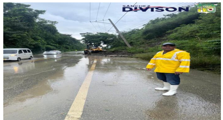
Diciembre 23, 2024

Maimón, Puerto Plata. En esta época navideña, un tiempo propicio para el amor, la alegría y la unidad, quiero enviar un mensaje de esperanza y solidaridad a toda nuestra comunidad.