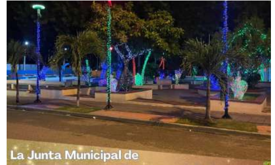
La Junta Municipal de

Que la luz de la Navidad ilumine nuestros corazones y nos inspire a seguir trabajando juntos por una Villa Sombrero más unida.