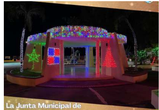
La Junta Municipal de