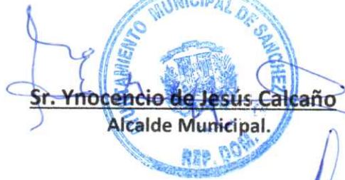
Sr. Ynocencio de Jesús Calcaño Alcalde Municipal.