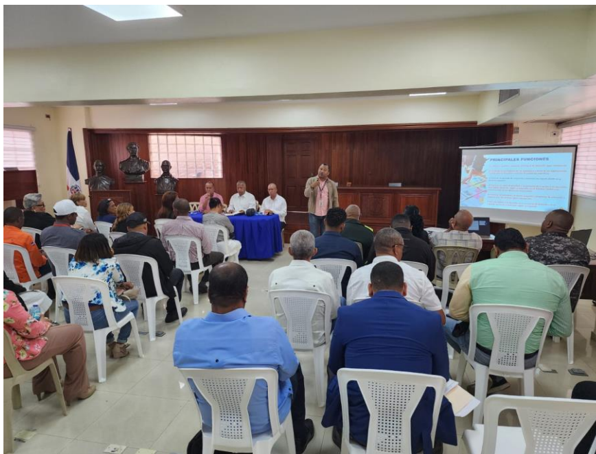
Foto actividad. “Taller de Funciones del CMD en la Planificación Municipal”. Salón de Sesiones del Concejo de Regidores, Ayuntamiento Municipal de S.C. 2025