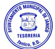
YARELY COLLADO TESORERA MUNICIPAL