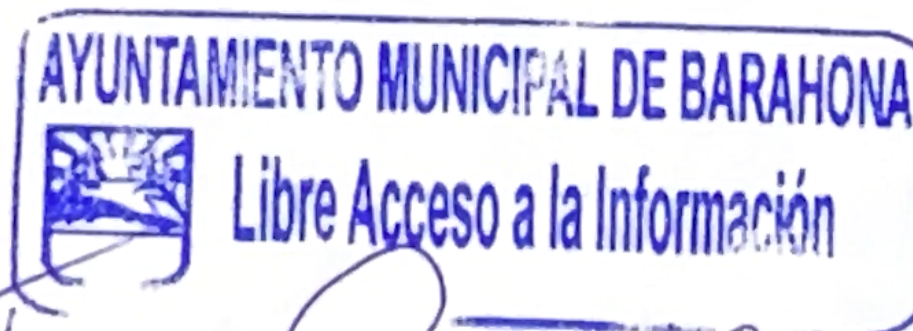
Traici Beltre Peña

En espera de su pronta respuesta, se despide de usted con un afectuoso saludo.