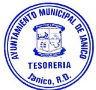
YARELY COLLADO TESORERA MUNICIPAL