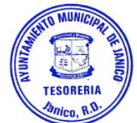
YARELY COLLADO TESORERA MUNICIPAL