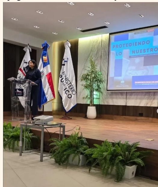
Moca, 22 de Octubre 2025