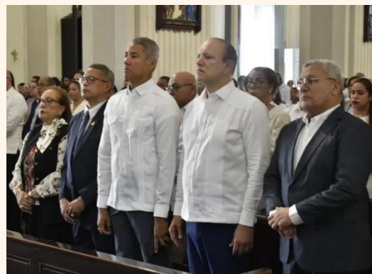
Moca, 19 de Octubre 2025