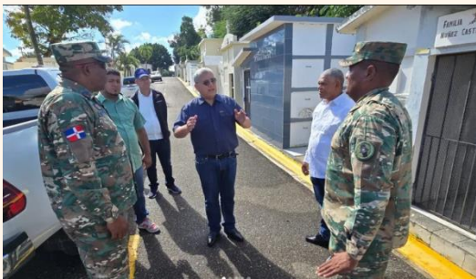
Moca, 09 de Noviembre 2025