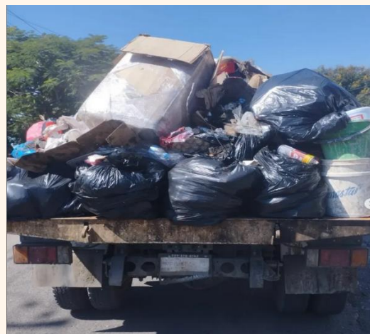
Moca, 15 de Octubre 2025