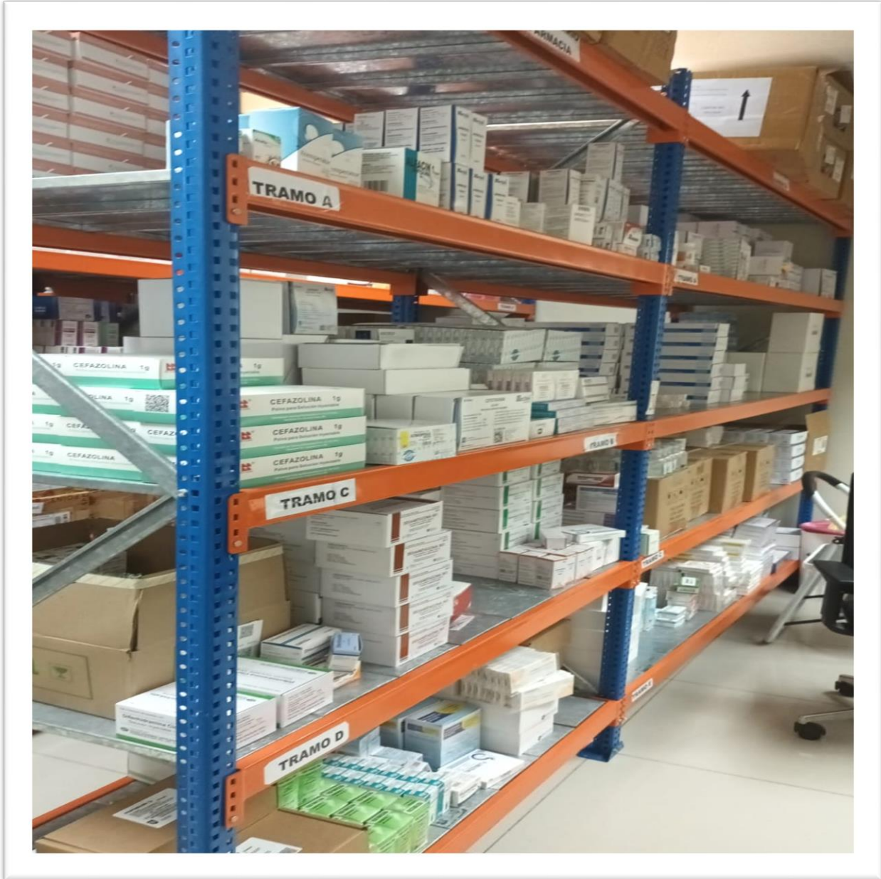
Ilustración 3 Productos en Almacén de Medicamentos e insumos.

RNC. 430135097 República Dominicana SERVICIO NACIONAL DE SALUD SERVICIO REGIONAL DE SALUD METROPOLITANO HOSPITAL PEDIÁTRICO DR. HUGO MENDOZA