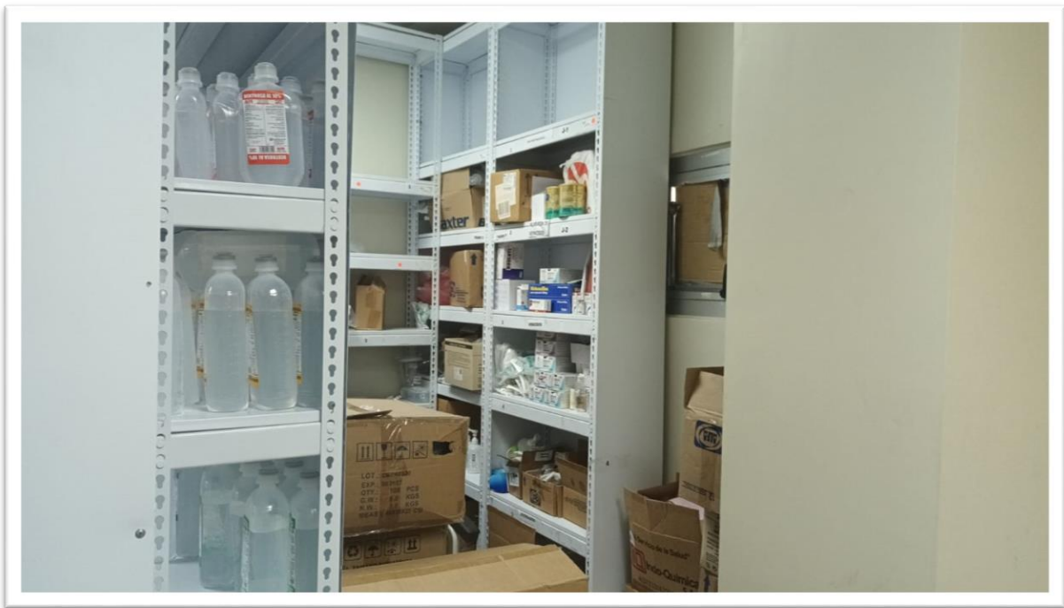
Ilustración 5 Farmacia Central: diseño de almacenamiento en forma de U para un mejor desplazamiento del personal y de los productos. También puede evidenciarse la identificación de los mismos.