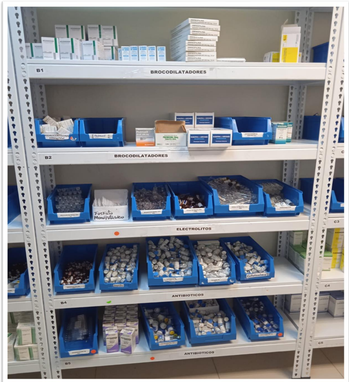
Ilustración 6 Almacenamiento de medicamentos e insumos totalmente identificados en Farmacia Central.

RNC. 430135097 República Dominicana SERVICIO NACIONAL DE SALUD SERVICIO REGIONAL DE SALUD METROPOLITANO HOSPITAL PEDIÁTRICO DR. HUGO MENDOZA