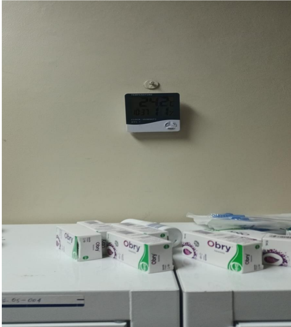
Ilustración 7 Termómetro funcionales tanto en Farmacia Central y Almacén de Farmacia

RNC. 430135097 República Dominicana SERVICIO NACIONAL DE SALUD SERVICIO REGIONAL DE SALUD METROPOLITANO HOSPITAL PEDIÁTRICO DR. HUGO MENDOZA