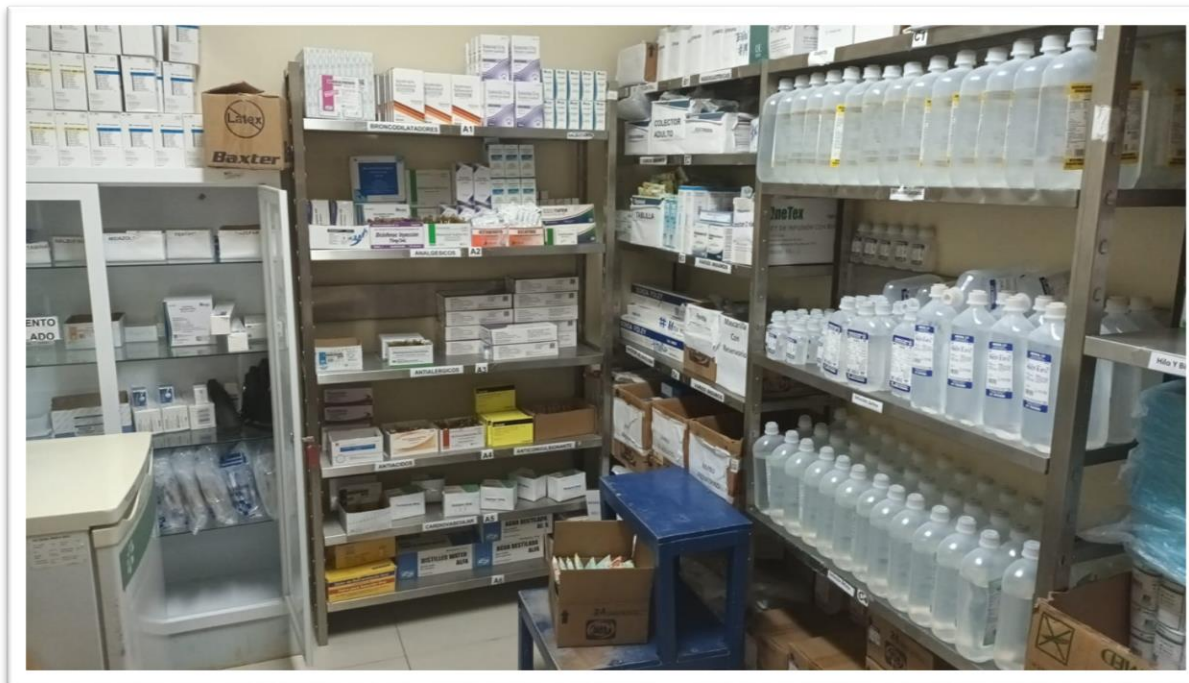
Ilustración 10 Farmacia de Emergencia, almacenamiento diseñado en forma de L para facilitar el desplazamiento de personas e insumos.

RNC. 430135097 República Dominicana SERVICIO NACIONAL DE SALUD SERVICIO REGIONAL DE SALUD METROPOLITANO HOSPITAL PEDIÁTRICO DR. HUGO MENDOZA