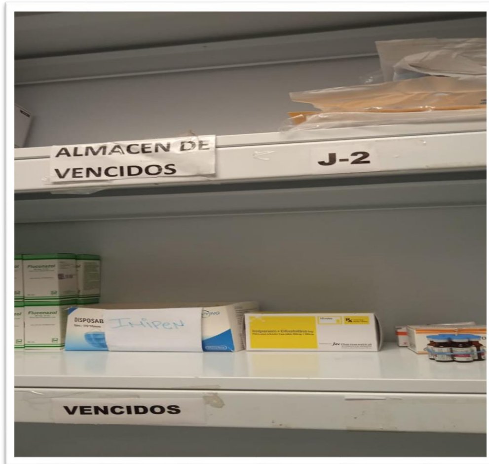
Ilustración 9 Área definida para el almacenamiento de productos vencidos.

RNC. 430135097 República Dominicana SERVICIO NACIONAL DE SALUD SERVICIO REGIONAL DE SALUD METROPOLITANO HOSPITAL PEDIÁTRICO DR. HUGO MENDOZA