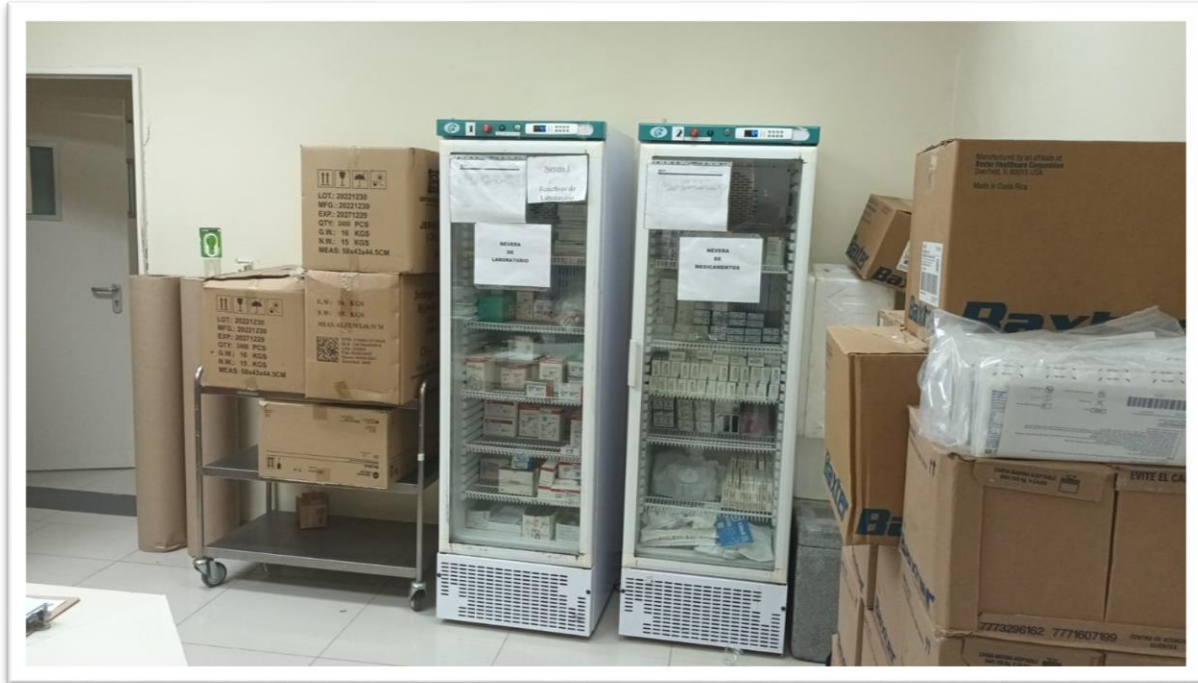
Ilustración 2 Refrigeradores en Almacén de Medicamentos e Insumos con termómetros en estado óptimo y sus respectivos formularios de registro de temperatura.

RNC. 430135097 República Dominicana SERVICIO NACIONAL DE SALUD SERVICIO REGIONAL DE SALUD METROPOLITANO HOSPITAL PEDIÁTRICO DR. HUGO MENDOZA