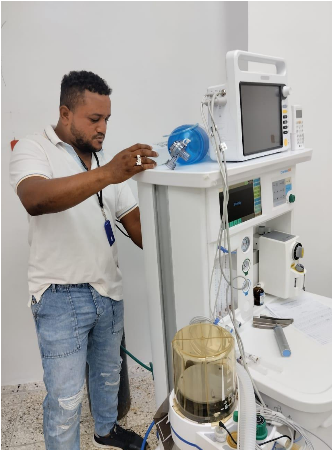
Imagen tomada en fecha 03/05/2024.