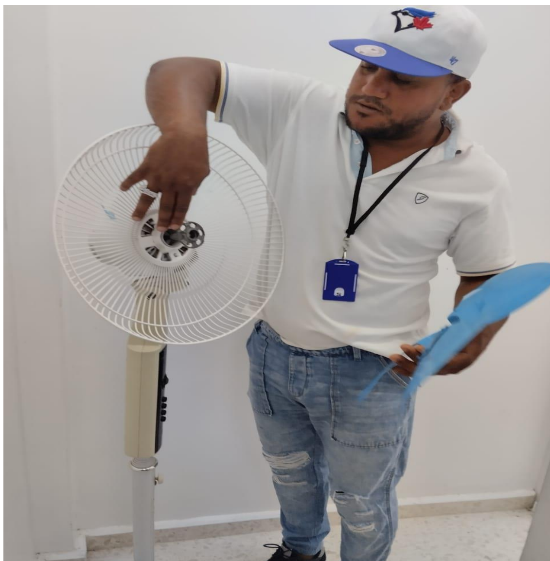
Imagen tomada en fecha, 28/05/2024.

Mantenimiento correctivo, abanico de pedestal.