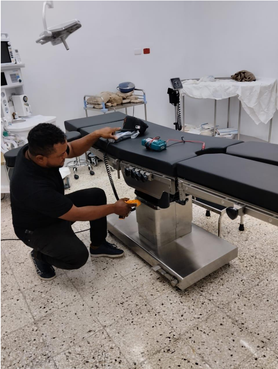
Imagen tomada en fecha 24/05/2024.