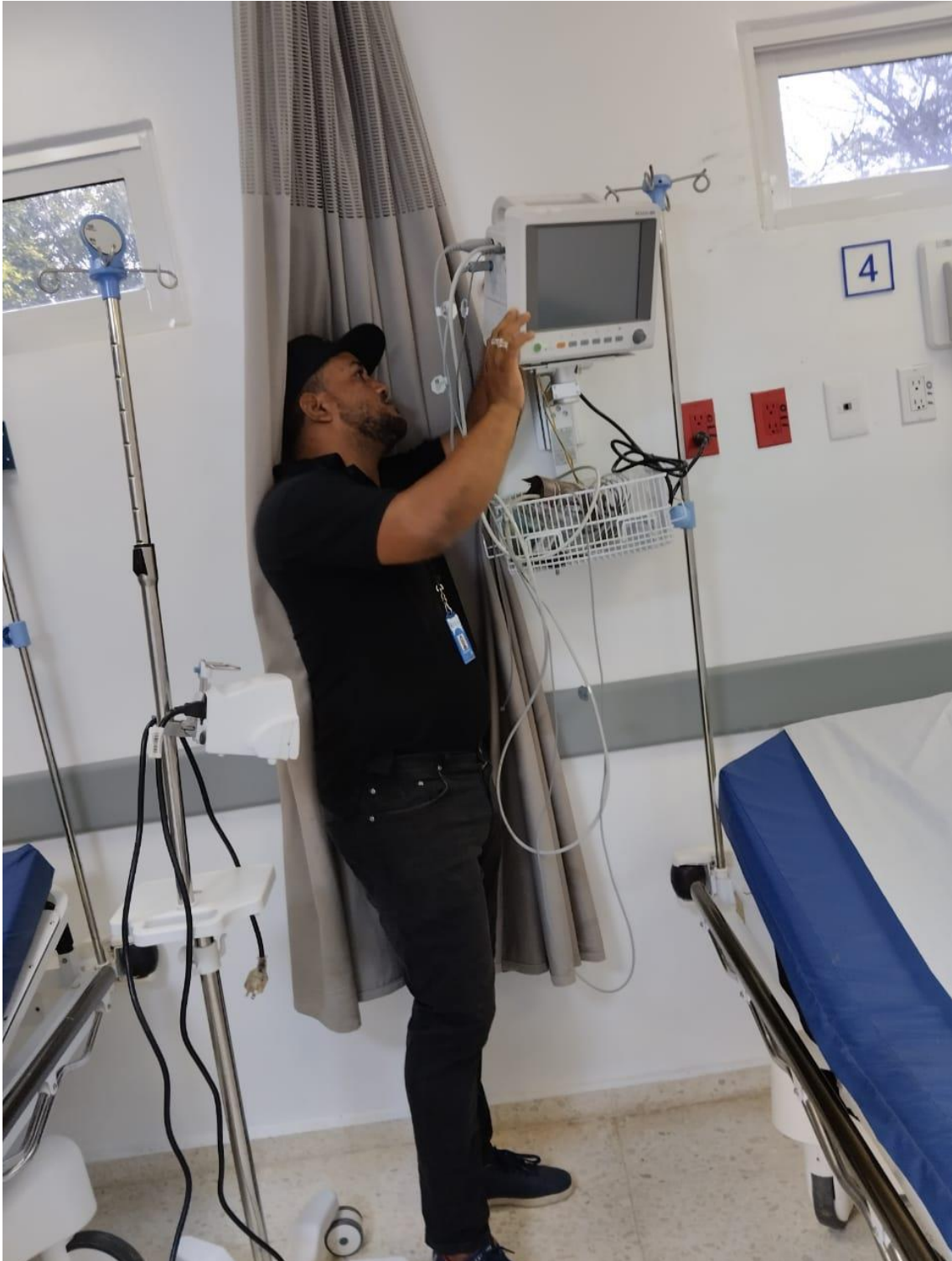
Imagen tomada en fecha 28/05/2024.