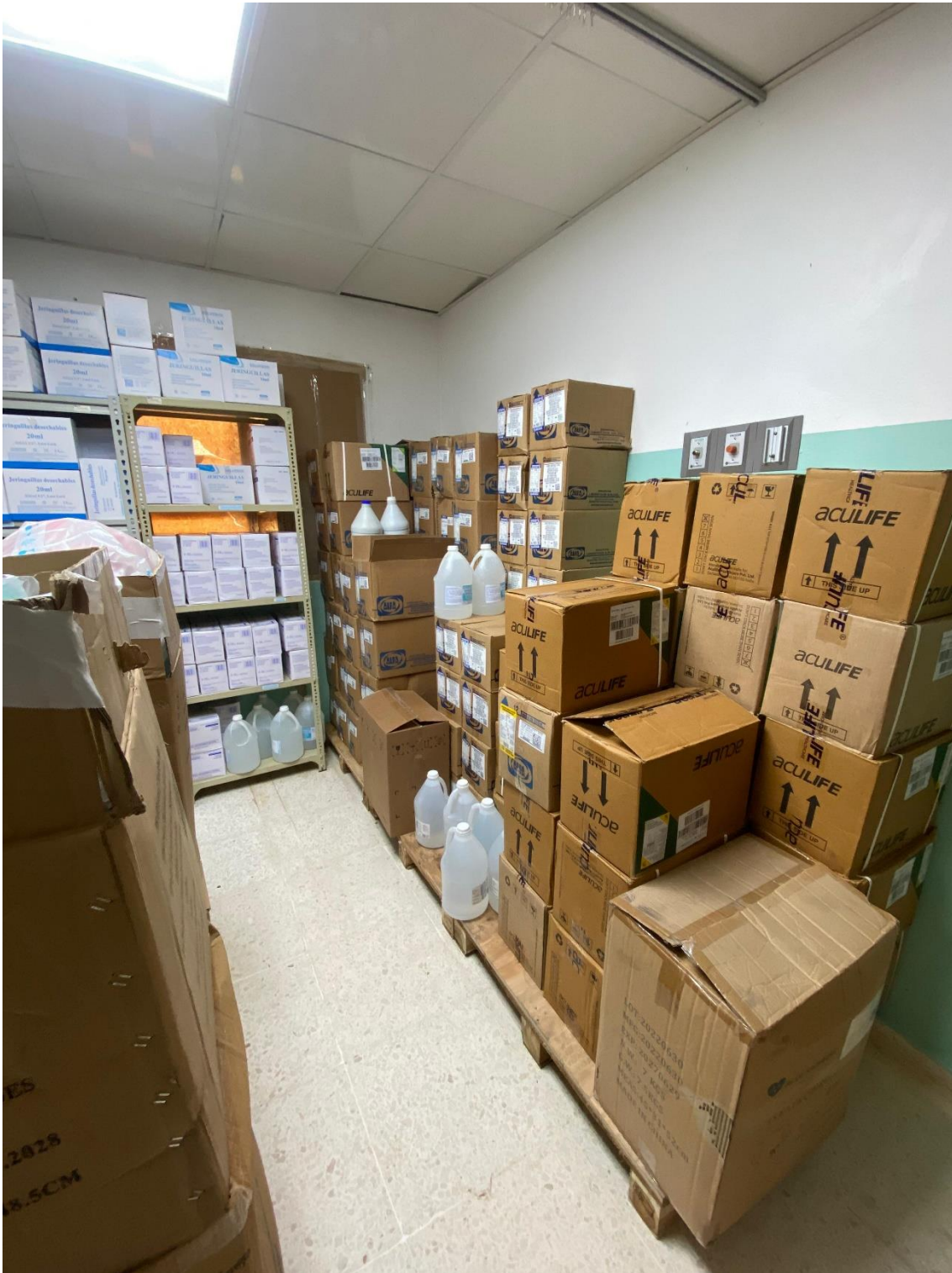
Ilustración 14. Soluciones colocadas en paletas.