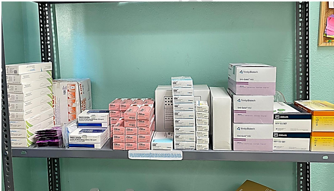
Ilustración 11. Medicamentos de planificación familiar y pruebas de laboratorio al 100%