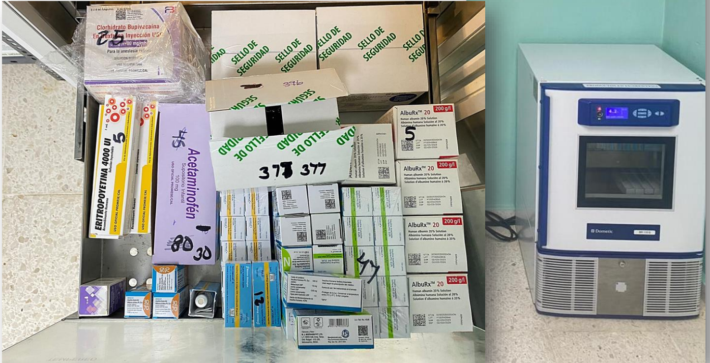
Ilustración 10. Nevera de farmacia central.