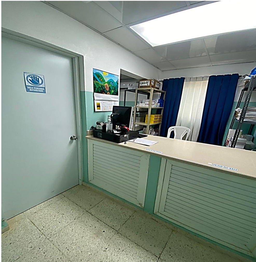
Ilustración 2. Área delimitada en farmacia central con acceso limitado a solo personal autorizado.