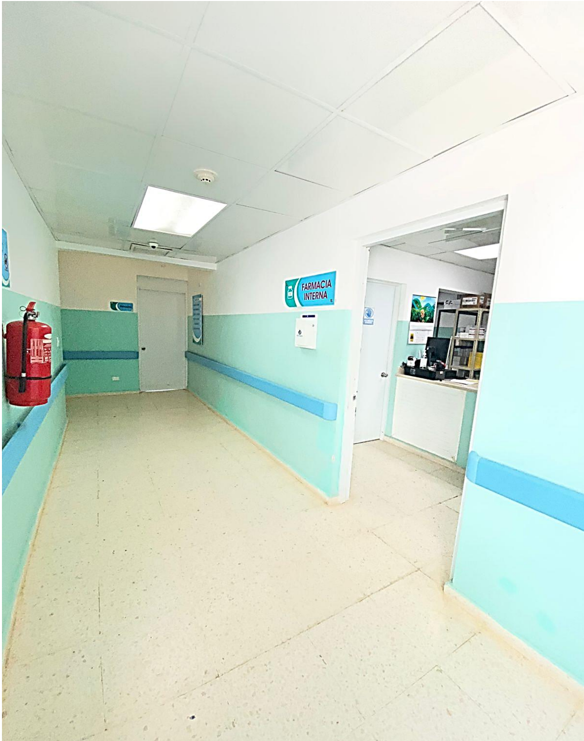
Ilustración 1. Farmacia central. Pasillo totalmente limpio, se puede evidenciar extintor colocado frente a puerta principal de farmacia la cual se mantiene cerrada para mantener la climatización.