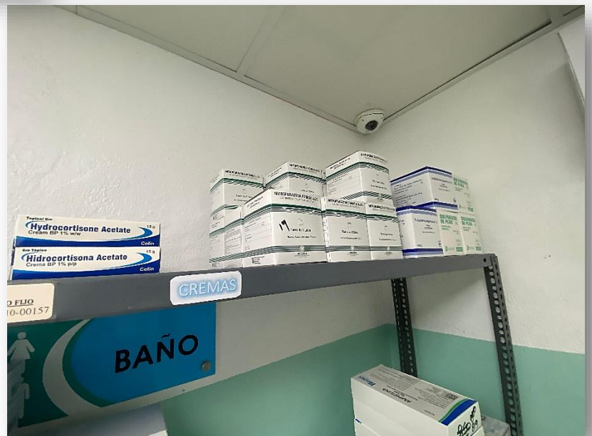
Ilustración 7. Farmacia central se encuentra dividida en forma farmacéutica como se puede evidenciar: