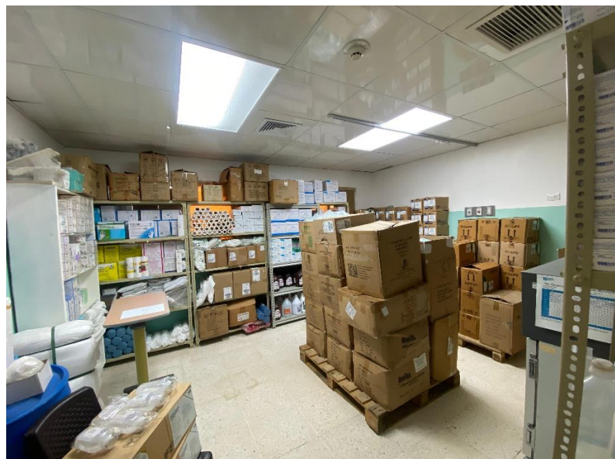
Ilustración 15. Almacén de farmacia central organizado en forma farmacéutica.