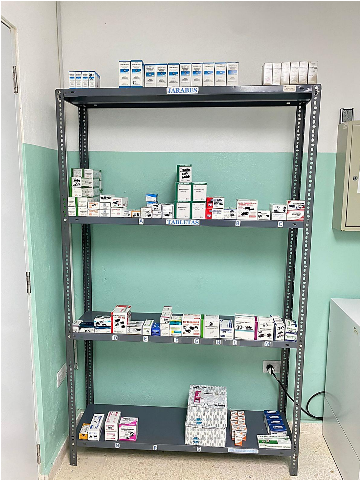
Ilustración 5. Farmacia Central. Tabletas, Jarabes y Broncodilatadores organizados en orden alfabético y dividido en forma farmacéutica.