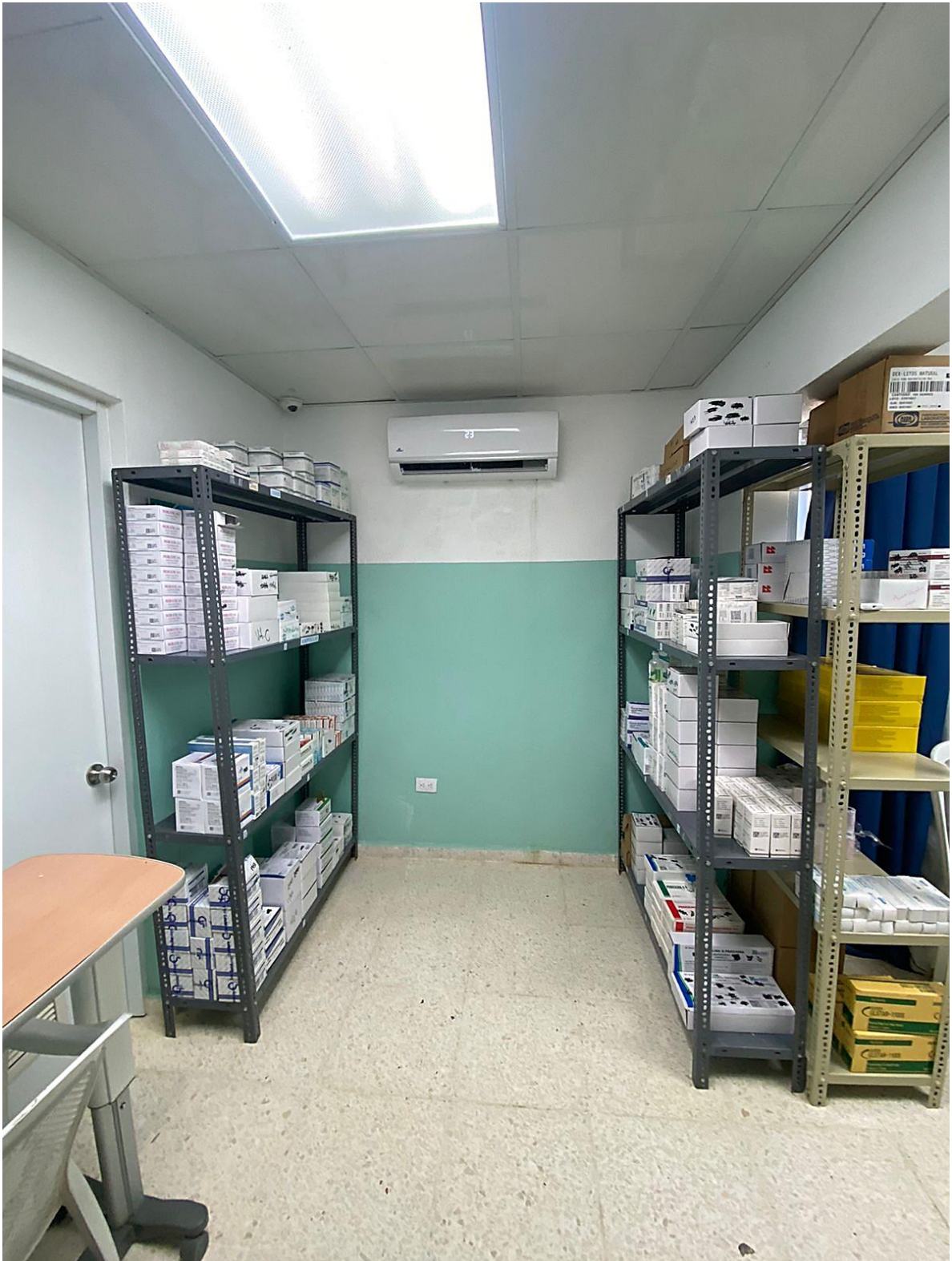
Ilustración 6. Farmacia centra organizada en forma de U para un mejor desplazamiento de los colaboradores. De igual manera se puede observar el aire que climatiza el área y que se cuenta con buena iluminación. También se puede evidenciar filtraciones en la pared donde se encuentra el aire acondicionado.