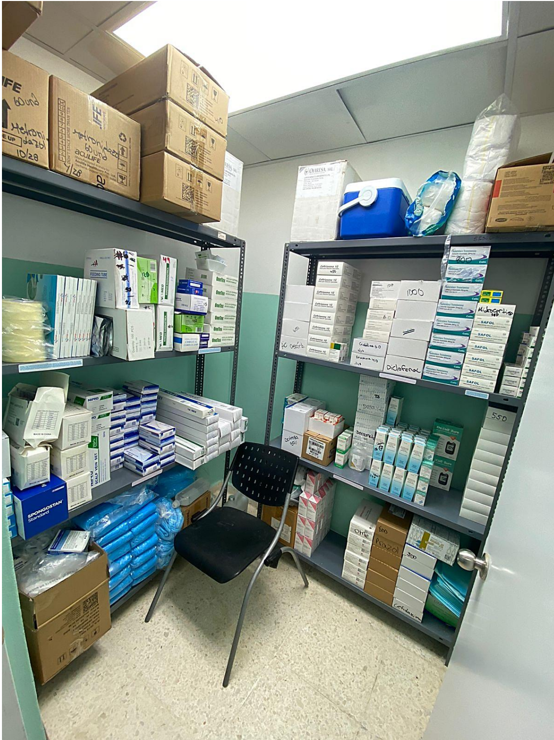
Ilustración 9. Depósito de farmacia central. Organizado por forma farmacéutica.