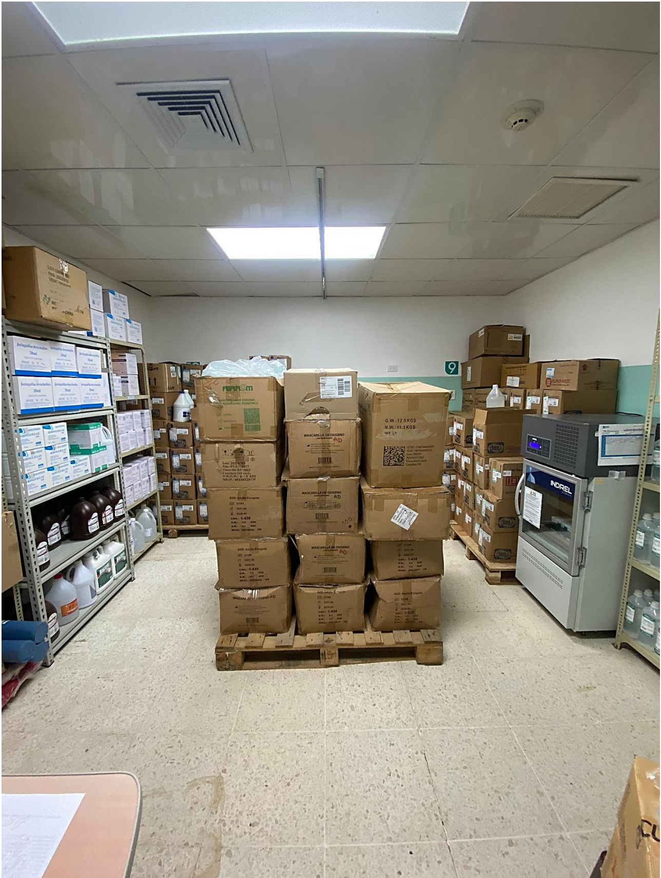
Ilustración 13. Almacén de farmacia central. Organizado en forma de U para un mejor desplazamiento de los colaboradores. También se puede evidenciar que hay una buena iluminación.