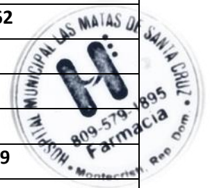
Ilustración 8. Formulario de próximos a vencer 2024, de los cuales se han ido retirando según su fecha.