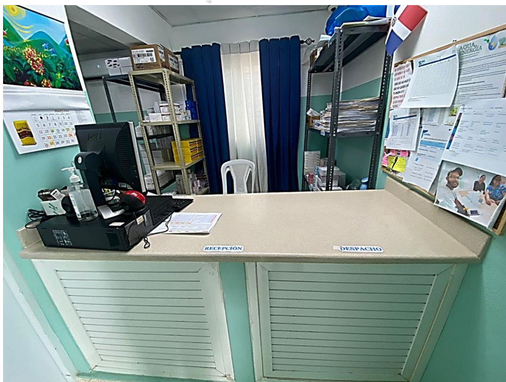
Ilustración 4. Se puede evidencia la meseta para la preparación de los pedidos e identificación del área de Recepción y Despacho