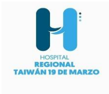
Tabla de contenido